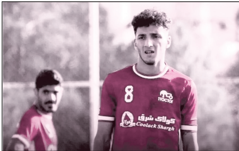
ساعت از برگزاری این نشست و وعده جذاب پاکو خمز، تیم زیر ۱۸ سال تراکتور در چارچوب مرحله نهایی لیگ برتر مقابل میهمانش سپاهان با شکست ۶ بر یک تحقیر شد. این تیم که در دور مقدماتی نیز با باخت سنگین ۷ بر صفر برابر ذوب آهن مورد اعتراض هواداران قرار گرفته بود، در دور نهایی لیگ برتر چهار بازی برگزار کرده و هر چهار دیدار خود را با شکست پشت سر گذاشته و قهرمان است. این درحالی است که در دیگر رده های پایه نیز حال تراکتور اصلاً تعریفی ندارد علی الخصوص تیم امید که در سال های اخیر جزو مدعیان قهرمانی لیگ برتر بود اما امسال در اکثر هفته ها در منطقه سقوط قرار داشت و هنوز هم وضعیت این تیم با توجه به اتفاقات رخ داده در کرمانشاه نامشخص بوده و معلوم نیست که آیا این تیم در لیگ برتر امیدهای کشور ماندنی خواهد شد یا خیر؟ در مورد تیم های جوانان و نوجوانان تراکتور نیز قابل ذکر است که تیم جوانان از صعود به مرحله پلی آف ناکام ماند و تیم نوجوانان که در فصل جاری با سپردن هدایت این تیم به یک خبرنگار پرحاشیه سوژه هم شده است، در دور

طرح نو؛ گروه ورزش تیم های پایه تراکتور در این فصل از رقابت های لیگ باشگاهی کشور نتایج بسیار ناامیدکننده ای را کسب کرده اند. پاکو خمز، سرمربی اسپانیایی تراکتور روی تیم های پایه این باشگاه نگاه ویژه ای دارد و به دنبال ساختار سازی در آکادمی تراکتور است. این سرمربی در فصل جاری هر وقت فرصت کرده در مسابقات تیم های پایه تراکتور حضور یافته و بازیکنان این تیم ها را هم زیر نظر گرفته است. او حتی سه بازیکن را هم از تیم های پایه به تیم بزرگسالان باشگاه انتخاب کرد. خمز در نشست صمیمی با اعضای تیم امید تراکتور که روز پنجشنبه در سالن کنفرانس باشگاه در جهت ابراز همستگی با تیم امید برگزار شد، از تیم های پایه به عنوان قلب باشگاه یاد کرد و بر لزوم توجه به این تیم ها سخن گفت. رویای احداث شهرک ورزشی برای تراکتور با هدف برگزاری اردوها و تمرینات تمام تیم های باشگاه در کنار یکدیگر نیز از جمله صحبت های قابل توجه سرمربی اسپانیایی بود که بازتاب زیادی هم داشت. اما جالب این است که درست به فاصله چند