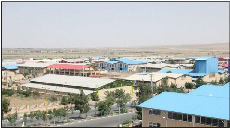
وی ابراز امیدواری کرد که با برنامه های حمایتی که از واحدهای تولیدی انجام می شود شاهد رشد و شکوفایی روز افزون صنعت استان باشیم.

ارتقای های به عمل آمده از سوی سازمان بهره وری ایران، شرکت شهرک های صنعتی استان اردبیل در میان شهرک های صنعتی کل کشور، حائز رتبه برتر شده است. مدیرعامل شرکت شهرک های صنعتی استان اردبیل ادامه داد: برگزاری دوره های آموزشی، حمایت از حضور در نمایشگاه های داخلی و خارجی، کمک به بازاریابی و اخذ گواهی نامه های استاندارد، اجرای خوشه های صنعتی، نیازسنجی و احصاء مشکلات صاحبان صنایع، از جمله برنامه هایی است که به منظور افزایش تولید و بهره وری واحدهای تولیدی انجام می شود.