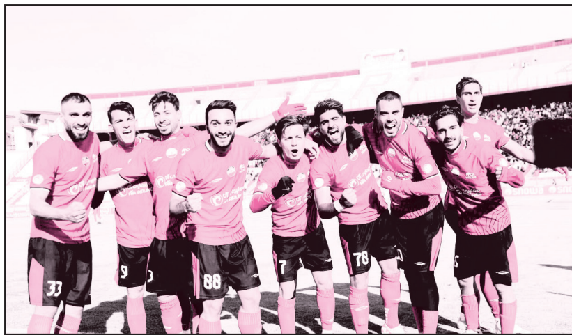
اساساً گل اول بازی در مسابقات تراکتور تعیین کننده بوده و نتیجه کار این تیم را مشخص کرده است. تیم خمز در ۱۰ بازی فصل جاری گل کرده است. تیم در ۶ بازی هم پس از اینکه گل اول را

طرح نو؛ گروه ورزش نتایج تیم فوتبال تراکتور با سرمربی اسپانیایی اش فرمول بسیار جالبی دارد. تراکتور که پس از پایان خوش در دور رفت لیگ بیست و سوم امیدوار بود تا در دور برگشت خود را روی غلطک پیروزی حفظ کند، برابر پرسپولیس شکست خورد تا نیم فصل دوم را نیز با ناکامی استارت بزند. با این وجود، این تیم در دومین گام در یک مصاف خانگی با استقلال خوزستان جبران کرد و با زدن ۲ گل نسخه حریف جنوبی را پیچید تا به جدول مسابقات برگردد. حالا تیم پرطرفدار دیار آذربایجان ۳۱ امتیازی است و ۸ امتیاز با صدر فاصله دارد که با توجه به یک بازی عقب افتاده خود می تواند این اختلاف را کمتر کند. اما فرمول نتایج تراکتوری ها خیلی جالب است: «گل اول را بزنی بزنده ای، بخوری بزنده ای».