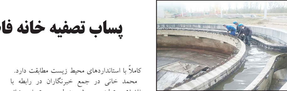
طرح نو؛ گروه خبر مدیرعامل آب و فاضلاب آذربایجان شرقی گفت: کیفیت پساب تولیدی تصفیه خانه فاضلاب تبریز

یکی از گلوگاه های مهم توسعه زیرساخت های عمرانی استان اردبیل کمبود منابع مالی بوده است، از همین رو در این دوره از مدیریت ارشد استان برای تامین منابع مالی مورد نیاز این طرح ها تلاش های مستمر و بی وقفه ای داشته اند به طوری که تقریباً هر هفته استاندار، نمایندگان و مدیران ارشد مربوط با حضور در مرکز کشور برای تامین منابع مالی تلاش کردند. در نتیجه این پیگیری ها به نظر می رسد بخش زیادی از این پروژه های زیرساختی و پیشران های توسعه در مراحل نهایی قرار دارد به طوری که به گفته رئیس سازمان مدیریت و برنامه ریزی استان اردبیل امسال پروژه های همچون راه آهن اردبیل - میانه، تونل حیران و قطعاتی از شبکه بزرگراهی استان به بهره برداری خواهد رسید. در همین زمینه در آخرین روز سال گذشته هشت هزار میلیارد ریال به اجرای طرح های زیرساختی استان که