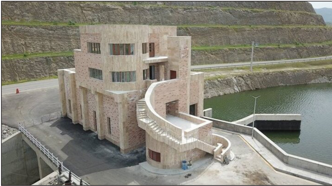
طرح نو؛ گروه گزارش

سد «قیزقلعه سی» به عنوان بزرگترین پروژه آبی مشترک ایران و جمهوری آذربایجان امروز/یکشنبه/ با حضور آیت الله «سیدابراهیم ریسی» و «الهام علی اف» روسای جمهور ۲ کشور در خدآفرین بهره برداری شد.