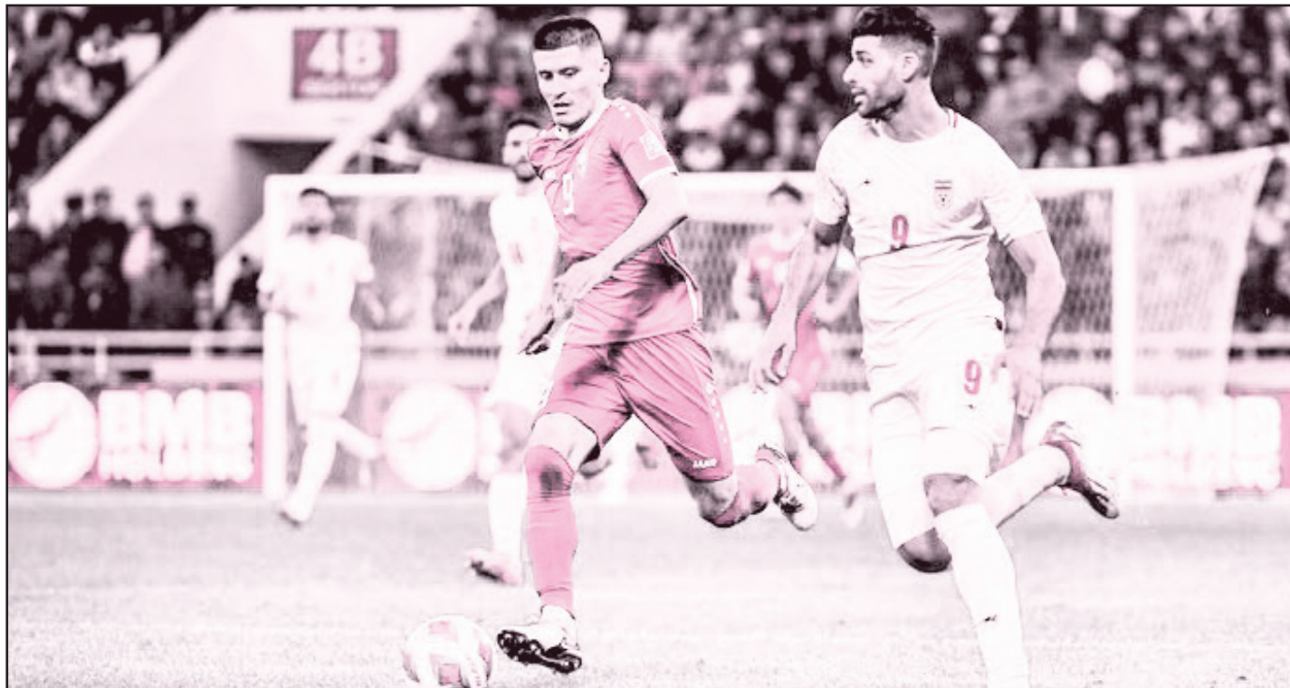
طرح نو؛ گروه ورزش

تیم ملی ایران فوتبال ایران در شرایط دیدار رفت برابر ازبکستان را با تساوی به پایان برد که برخی اشتباهات فردی بازیکنان و البته تفکرات امیر قلعه نویی یک برد شیرین را از بین برد. تیم‌های ملی فوتبال ایران و ازبکستان در هفته ششم مرحله دوم مقدماتی جام جهانی ۲۰۲۶ روز سه شنبه ۲۲ خرداد و در ورزشگاه آزادی تهران رو در روی هم قرار می‌گیرند. در جدول گروه E تیم‌های ایران و ازبکستان با ۱۳ امتیاز و به دلیل تفاضل گل در رده‌های اول و دوم قرار گرفته‌اند و پیروزی در این بازی برای هر دو تیم در جهت صدرنشینی بسیار اهمیت دارد. تیم‌های ایران و ازبکستان در تاریخ ۳۰ آبان ۱۴۰۲ در تاشکند رو در روی هم قرار گرفتند که در این بازی با اینکه ایران توانست نیمه اول را با دو گل رامین رضایتیان و مهدی طارمی با برتری به پایان برساند اما در نیمه دوم دو گل دریافت کرد تا بازی با نتیجه تساوی دو بر دو به پایان برسد. همین اتفاق ندهایی را به تیم امیر قلعه نویی وارد کرد که چرا باید بازی دو بر صفر جلو افتاده را در نیمه مربیان به حریف واگذار کند. هر چند سرمربی تیم ملی پس از این دیدار اشتباهات فردی بازیکنان را دلیل این اتفاق عنوان کرد اما تفکرات او هم می‌توانست مانع از مساوی شدن بازی شود. در ادامه این مطلب به برخی اشتباهاتی که از سوی بازیکنان تیم ملی فوتبال ایران در دیدار رفت با ازبکستان صورت گرفت و منجر به از دست رفتن دو