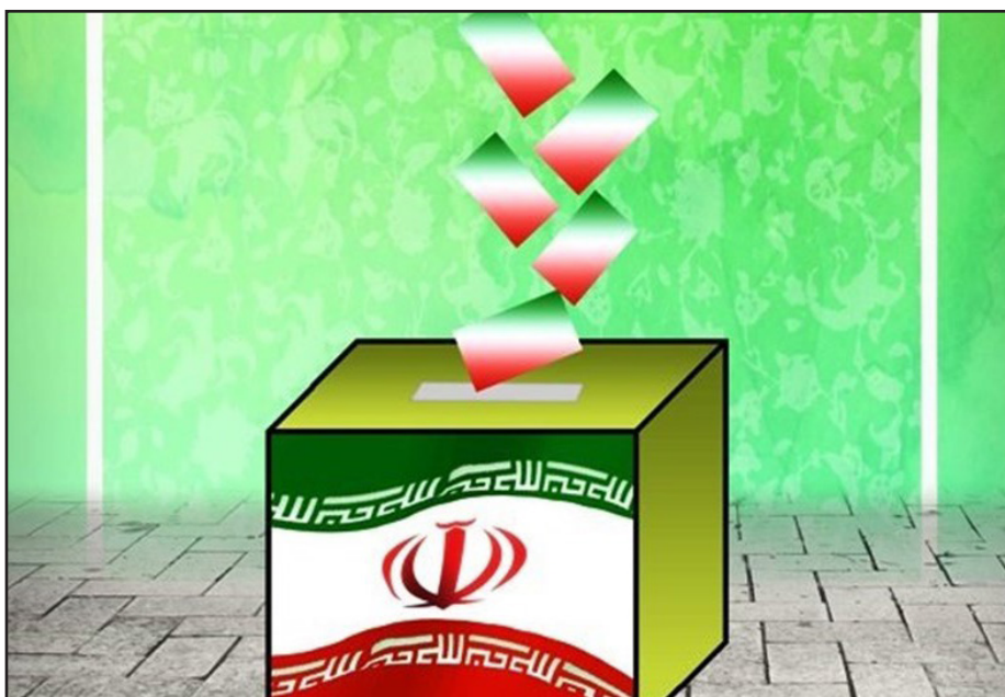
طرح نو؛ گروه سیاست

انتخابات ریاست جمهوری ایران در راه است و بار دیگر ملت آماده‌اند تا با حضور در پای صندوق‌های رأی، سرنوشت کشور خود را رقم بزنند. انتخابات ریاست جمهوری در کشور ما همواره یکی از مهم‌ترین رویدادهای سیاسی و اجتماعی بوده است. این رویداد، نه تنها فرصت انتخاب رئیس‌جمهور آینده را به مردم می‌دهد، بلکه نقش مهمی در تعیین مسیر سیاست‌های کلان کشور دارد.