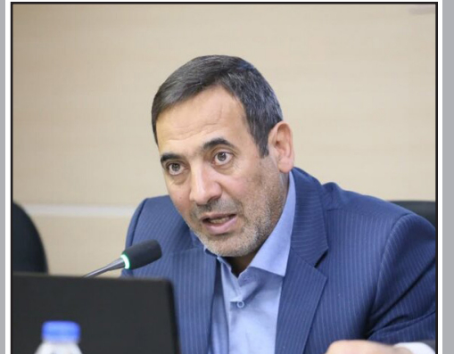
طرح نو؛ گروه خبر

رئیس سازمان مدیریت و برنامه‌ریزی آذربایجان شرقی بر ضرورت ارتقای کیفیت و سهم ارزش افزوده نفت و گاز در استان تاکید کرد.