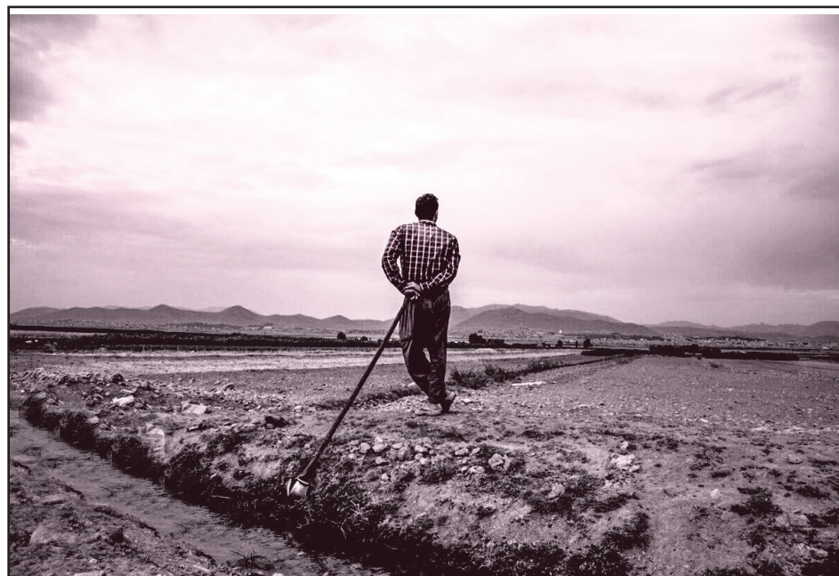
به همان میزان صحت پیش بینی ها افزایش می یابد.

می دهد، یادآور شد: آن هنگام در طول سال تنها ۲ بار دمای بالای ۲۵ درجه سانتی گراد ثبت شده بود، در حالی که پس از سال ۱۴۰۰ دست کم به ۱۰ تا ۱۵ بار یا روزهای یخبندان از ۱۴۰ روز به نزدیک ۱۰۰ روز رسیده است.