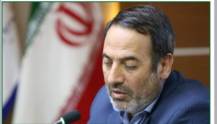
طرح نو؛ گروه خبر

رئیس سازمان مدیریت و برنامه‌ریزی آذربایجان شرقی گفت: باید راهبرد آبی استان در ۴ سال آتی مشخص شود.