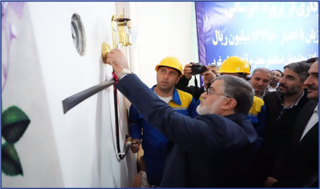
طرح نو؛ گروه خبر

معاون هماهنگی امور عمرانی استاندار آذربایجان غربی با اشاره به افتتاح و کلنگ زنی یک هزار و یک طرح عمرانی همزمان با هفته دولت در استان گفت: از این تعداد، ۹۳۶ طرح به بهره برداری خواهد رسید که برای اجرای آنها، ۸۶ هزار و ۲۲۰ میلیارد ریال هزینه شده است.