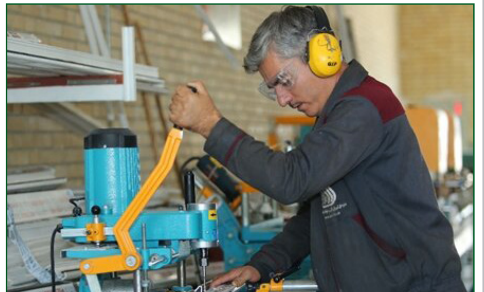
طرح نو؛ گروه گزارش ماهر به نفع کارفرماست زیرا موجب افزایش بهره وری به اعتقاد کارشناسان تبدیل کارگر ساده به نیروی کار و کیفیت تولید، کاهش حوادث کار و ارتقای سطح

مهارت نیروهای کار در بنگاه می شود. به گزارش ایسنا، با توجه به افزایش روز افزون تعداد دانش آموزان و آمار فارغ التحصیلان بیکار و عدم تناسب رشته های تحصیلی با نیاز بازار کار، اهمیت مهارت آموزی و بهره مندی از آموزش های فنی و حرفه ای بیش از پیش احساس می شود؛ در چنین شرایطی آشنایی با محیط واقعی کسب و کار و ارتقای سطح مهارت افراد در ورود به بازار کار مؤثر است. یکی از راه های آشنایی با محیط واقعی کسب و کار، ایجاد و توسعه مراکز آموزش جوار و بین کارگاهی است که تأثیر بسزایی در ارتقای توان فنی و اشتغال پذیری افراد در حوزه های مختلف صنعت دارد، چنانچه کارشناسان بازار کار بر این باورند که توسعه و ایجاد این مراکز در کنار بنگاه ها و صنایع علاوه بر رونق بخش های تولیدی زمینه افزایش سطح مهارت کارگران و شاغلان واحدهای اقتصادی را فراهم می کند. در همین راستا مهرداد عظیمی - معاون وزیر تعاون، کار و رفاه اجتماعی در گفت و گو با ایسنا، هدف از ایجاد مراکز آموزش فنی و حرفه ای جوار کارگاهی و بین