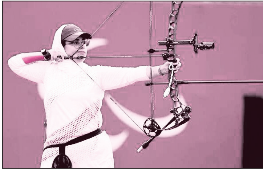
کسب مدال قرار گرفت. حریف قدرتمند خود از بریتانیا و قهرمان پارالمپیک توکیو را با عملکردی درخشان ۱۴۶ بر ۱۴۳ شکست داد.