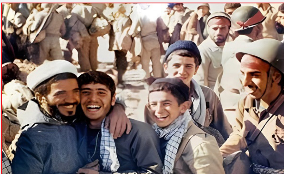
کریم را روایت می کند. شده است.

طرح نو؛ گروه فرهنگ و ادب طنز، این حلقه مفقوده در ادبیات دفاع مقدس، با ایجاد فضایی شاداب و سرگرم کننده، می تواند بار احساسی و سنگینی موضوع را کاهش دهد و به کودکان و نوجوانان این امکان را دهد که با نگاهی متفاوت به وقایع جنگ بنگرند. دفاع مقدس، یکی از مهم ترین و تأثیرگذارترین مقاطع تاریخ معاصر ایران است که نه تنها بر سرنوشت کشور، بلکه بر زندگی نسل های بعد از آن نیز تأثیر گذاشته است. انتقال مفاهیم و ارزش های مرتبط با این دوران به کودکان و نوجوانان، امری ضروری و حیاتی به شمار می آید. یکی از راه هایی که می توان این مفاهیم عمیق و گاه سنگین را به گونه ای جذاب و قابل فهم برای نسل امروز ارائه داد، ادبیات ژانری و ژانر طنز است. طنز، این حلقه مفقوده در ادبیات دفاع مقدس، با ایجاد فضایی شاداب و سرگرم کننده، می تواند بار احساسی و سنگینی موضوع را کاهش دهد و به کودکان و نوجوانان این امکان را دهد که با نگاهی متفاوت به وقایع جنگ بنگرند. این نوع ادبیات می تواند احساس همدلی، شجاعت و فداکاری را در دل آن ها بیدار کند و در عین حال، آن ها را به تفکر انتقادی و خلاقیت نیز تشویق کند. علاوه بر این، استفاده از طنز در روایت داستان های دفاع مقدس می تواند به تقویت حس هویت ملی و تاریخی در نوجوانان کمک کند و با پرداختن به چالش ها و ماجراهای دوران جنگ به صورت طنزآمیز، به آن ها یادآوری کند که حتی در سخت ترین شرایط نیز امید، دوستی و همکاری و شادی وجود دارد. در ادامه این مطلب ۷ نمونه از کتاب های کودک و نوجوان با موضوع دفاع مقدس را که به زبان طنز نوشته شده اند، معرفی کرده ایم: