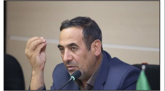
طرح نو؛ گروه اقتصاد

رئیس سازمان مدیریت و برنامه ریزی آذربایجان شرقی گفت: دیوان محاسبات در این استان همواره نقش ارشادی، مشاوره و راهنمایی داشته و موجب کاهش روزافزون فساد اداری شده است.