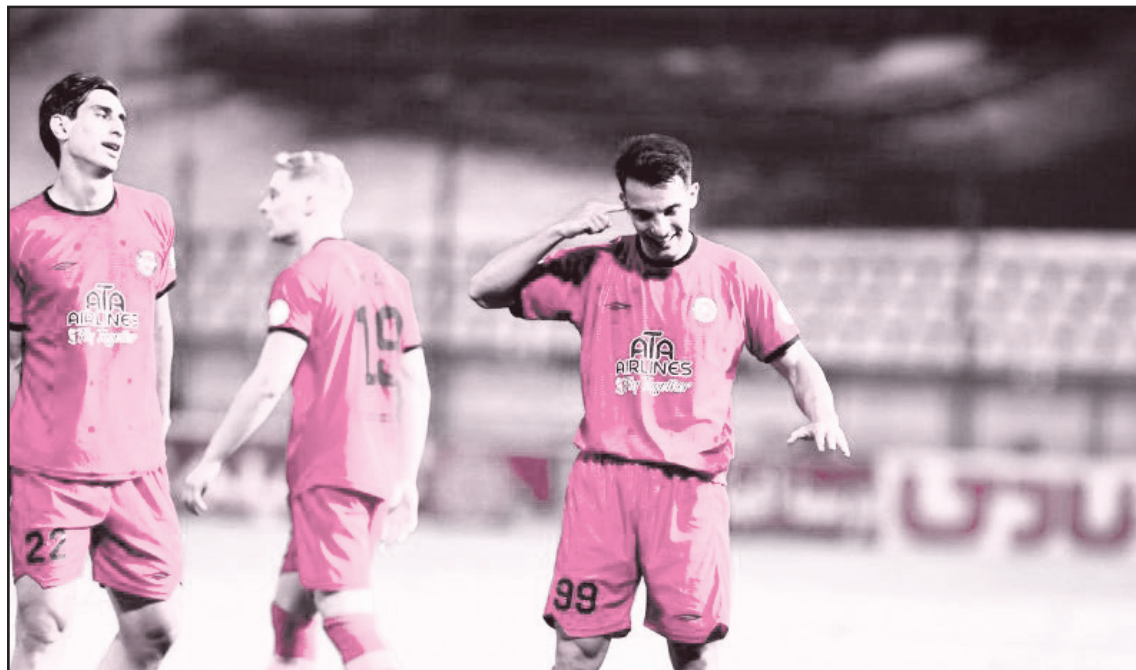
به هیچ چیز دیگری فکر نمی‌کنم.

فوت قلب گرفتیم. به هم گفتیم که باید برویم و صدمان را بگذاریم. البته ما حتی در تمرین هم اگرچه هواداران نیستند اما به آنها فکر می‌کنیم و از جان و دل برایشان زحمت می‌کشیم.