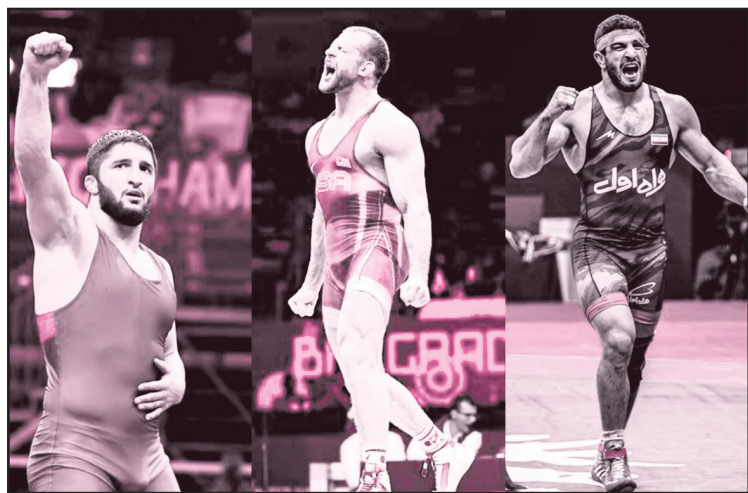
عبدالرشید سعدالله‌یف که حضور در المپیک پاریس را با تصمیم IOC از دست داد، حالا می‌خواهد به تشک کشتی برگردد و تمریناتش