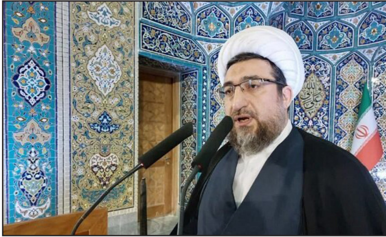
خدایان هستند ولی رژیم جنایتکار آب، برق، گاز و انرژی را بر روی این مظلومان قطع کرده است.

مسئولان کنسولی، لشگری، دانشجویان، کارمندان، بازاریان و روحانیون با حضور در این تجمع و با سر دادن شعارهای همچون (مرگ بر اسرائیل، مرگ بر آمریکا، ای رهبر آزاده آماده ایم (آماده) ضمن محکومیت ترور سید حسن نصرالله، آمادگی خود را برای اعزام به جبهه های نبرد اعلام کردند.