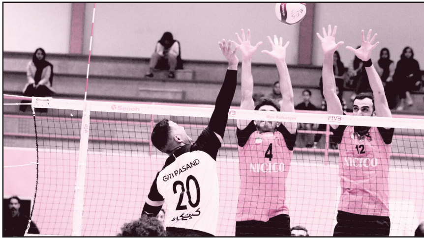
یکی از دلایلی که باید لیگ ۱۴ تیمی شود، جلوگیری از سقوط تیم‌های با پتانسیل بالاست. تیم‌هایی مانند ملی ایران خواهد بود.

طرح نو؛ گروه ورزش با توجه به شرایط والیبال ایران، لازم و ضروری است لیگ برتر والیبال از فصل آینده به صورت ۱۴ تیمی برگزار شود.