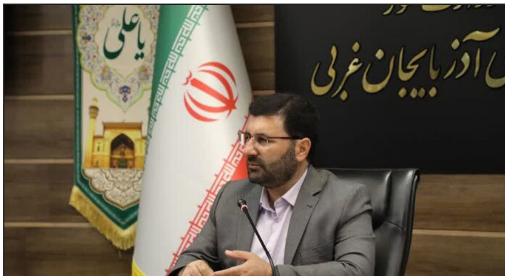
طرح نو؛ گروه جامعه

معاون هماهنگی امور اقتصادی استاندار آذربایجان غربی با اشاره به لزوم برنامه ریزی لازم برای جلوگیری از بروز مشکل در بازار نوروز و ماه مبارک رمضان گفت: به همین منظور ۴۲۵ تن میوه شب عید خریداری شده که پس از قیمت گذاری زیر قیمت بازار عرضه خواهد شد.