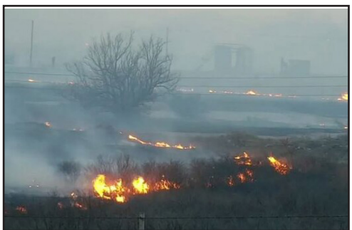
دادن حریق تاثیرگذار هستند.