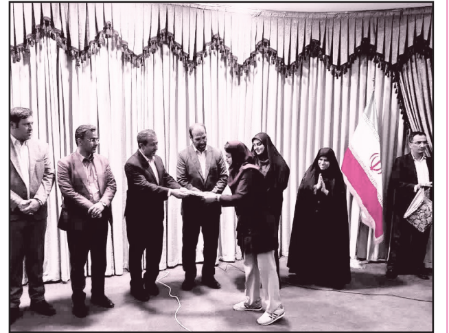
طرح نو؛ گروه گزارش

مراسم گرامی داشت روز دختر با حضور فرماندار و جمعی از مسئولین شهرستان در سالن آمفی تئاتر کتابخانه شهید حاج قاسم سلیمانی برگزار شد.