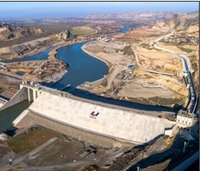
این کارشناس حوزه منابع آبی با بیان اینکه حوضه آبریز ارس در کشورهای ایران، ترکیه، ارمنستان و جمهوری

آذربایجان قرار داشته و این رودخانه مرزی همواره محل ارتباط دیپلماتیک این چهار کشور بوده و از اهمیت بسیار زیادی برخوردار است؛ گفت: بهره‌برداری از سد قیزقلعه‌سی نیز نشانگر دیپلماسی موفق آبی دولت آیت‌الله رئیسی است، چرا که تعاملات با جمهوری آذربایجان را افزایش داده و صیانت از دو پل تاریخی در مخزن سد نیز موجب توسعه فرهنگی کشورها خواهد بود. وی ادامه داد: با استقرار دولت مردمی سیزدهم و هدف‌گذاری برای افتتاح پروژه‌های نیمه‌تمام با عنوان پروژه‌های اولویت‌دار، تخصیص اعتبارات پروژه‌های عمرانی سرعت بیشتری گرفته و امروز این سد مشترک ایران و آذربایجان با عنایت به قدرت خدمات فنی و مهندسی ایران و به دست مهندسین توانمند داخلی آماده بهره‌برداری است. به گفته این کارشناس، سد قیز قلعه‌سی با پیچیدگی فنی و اجرائی تجهیزات هیدرومکانیکال، بزرگ‌ترین و مهم‌ترین پروژه مرزی آذربایجان‌شرقی است که آب بزرگ‌ترین شبکه آبیاری زهکشی شمالغرب کشور را تامین و حقایبه یک میلیارد مترمکعب در سال با تشکیل