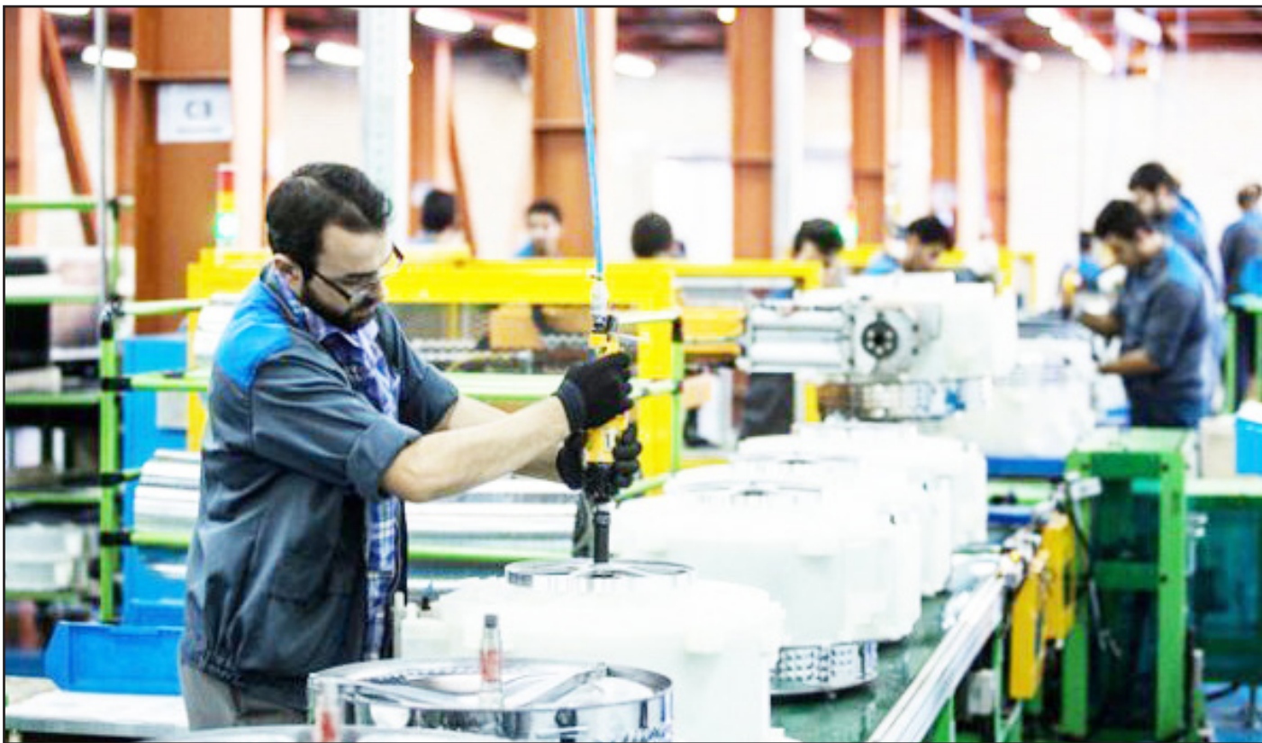
مردم بپردازد و با اقدامات حمایتی، به بهبود وضعیت کسب و کارها کمک کند.

آذربایجان شرقی، با مشکلات و چالش های متعددی روبرو است که نیاز به توجه ویژه و اقدامات فوری از سوی رئیس جمهور جدید دارد. از اصلاح مدیریت معدن مس سونگون و بهسازی زیرساخت های حمل و نقل گرفته تا حل مشکلات اقتصادی و انرژی و حمایت از واحدهای تولیدی، انتظارات مردم این استان بالا است. همچنین، توجه به مسائل زیست محیطی و توسعه پایدار از دیگر نیازهای مهم این استان است. امید است که دولت جدید با اتخاذ اقدامات مؤثر و برنامه ریزی دقیق، به رفع مشکلات موجود و بهبود شرایط زندگی مردم آذربایجان شرقی بپردازد. تنها از طریق چنین اقداماتی است که می توان به رشد و توسعه پایدار استان دست یافت و کیفیت زندگی مردم را ارتقا بخشید. / مهر