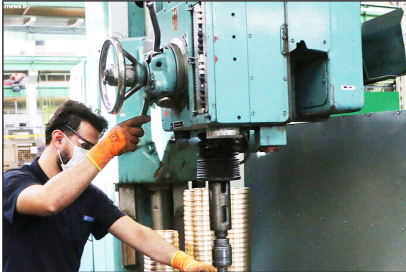
درصد اشتغال ایجاد شده را شامل می شود. ۱۵۷.۷ درصد است و برخی دستگاه ها تاکنون عملکردی در این زمینه نداشته اند.

فوتی ادامه داد: از مجموع طرح های برخوردار شده از تسهیلات، ۶ هزار و ۸۲۴ طرح ایجاد، ۶ هزار و ۹۳۶ طرح توسعه ای، ۶۶۶ طرح تکمیلی و ۴۸ طرح برای سرمایه در گردش است.