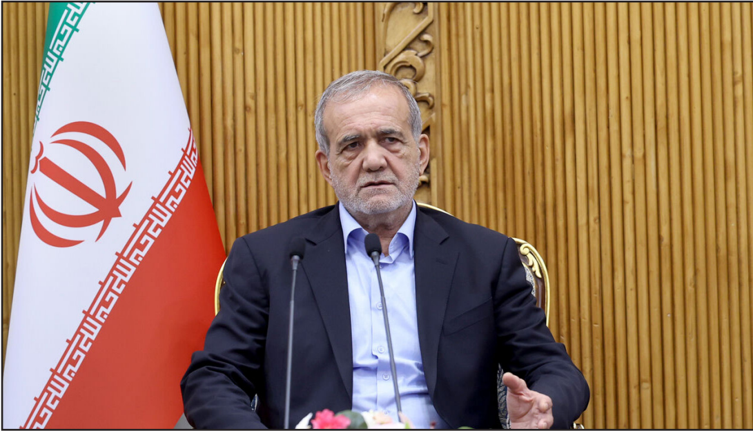
طرح نو؛ گروه گزارش

رئیس‌جمهور با بیان اینکه در سفر به قطر ۲ هدف را دنبال می‌کنیم، گفت: نخست اینکه با دولت قطر گفت‌وگوهایی در زمینه اقتصادی، اجتماعی، فرهنگی و سرمایه‌گذاری خواهیم داشت و تفاهم‌نامه‌هایی امضا خواهد شد.