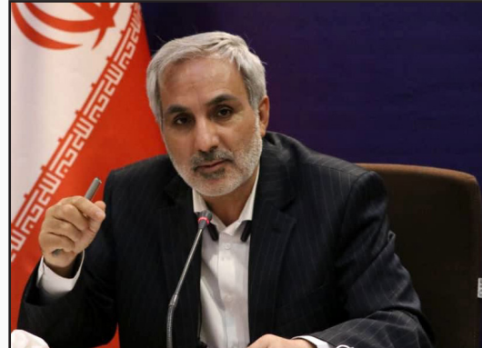
طرح نو؛ گروه گزارش

جعفری آذر اظهار کرد: شب گذشته صدها موشک با فاصله هزاران کیلومتر از ایران به قلب اسرائیل و مقرهای راهبردی و نظامی رژیم صهیونیستی شلیک شد که گزارش اولیه حاکی از اصابت ۹۰ درصدی آنها به هدف است و ثابت کرد که برخلاف ادعاها،