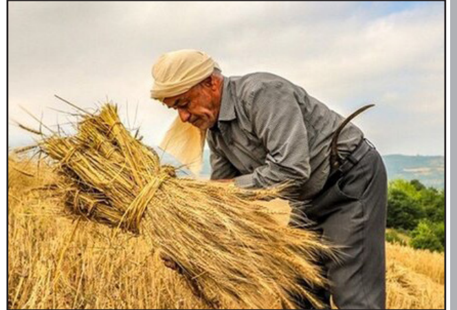
طرح نو؛ گروه خبر

رئیس سازمان مدیریت و برنامه ریزی آذربایجان شرقی به تبیین برنامه‌های پیشران توسعه استان در بخش‌های کشاورزی، محیط زیست و منابع طبیعی استان پرداخت. حیدر فتح زاده در جلسه‌ای با محمد ابراهیم نیا، رئیس امور کشاورزی، آب و محیط زیست سازمان برنامه و بودجه کشور بر ضرورت ارتقای بهره‌وری در بخش تولید کشاورزی با کاربست فناوری‌ها و ارتقای عملکرد در سطح هکتار تاکید کرد.