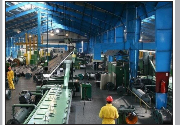
طرح نو؛ گروه اقتصاد

سرپرست اداره کل صنعت، معدن و تجارت آذربایجان شرقی گفت: امسال واحدهای صنعتی و معدنی استان سه هزار و ۳۶۰ میلیارد ریال تسهیلات گرفتند.