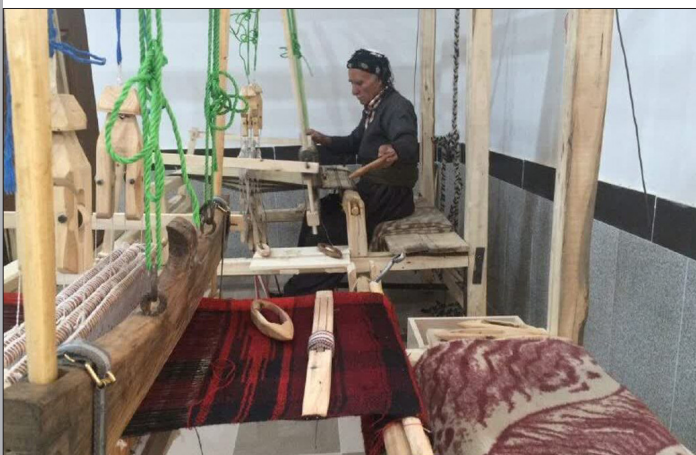
طرح نو؛ گروه خبر

مدیرکل میراث فرهنگی، گردشگری و صنایع دستی آذربایجان غربی گفت: ایجاد خانه صنایع دستی در پیرانشهر می‌تواند فرصت‌های شغلی جدیدی برای هنرمندان و صنعتگران محلی فراهم کرده و زمینه صادرات محصولات صنایع دستی منطقه را تقویت کند.