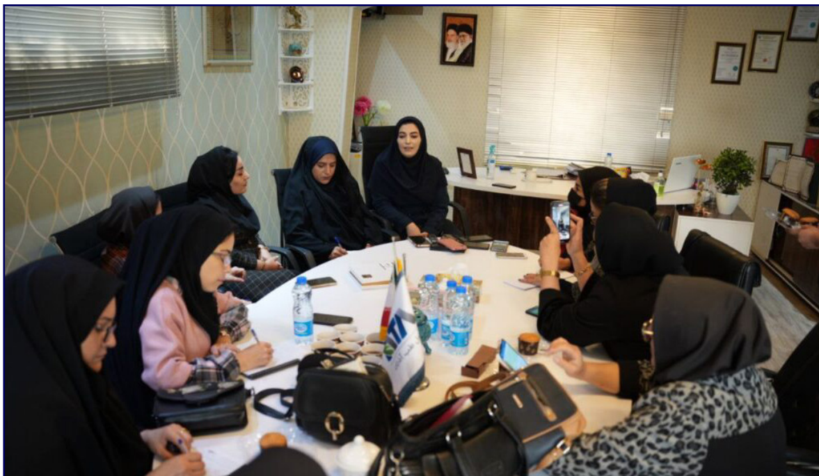
طرح نو؛ جنبه معصومی سرای

زنان پیشگام در عرصه تولید، با قدرت و خلاقیت خود نه تنها مرزهای اقتصادی را جابه‌جا می‌کنند بلکه با هر گام محکم، اقتصاد کشور را به سوی رشد و شکوفایی هدایت می‌کنند.