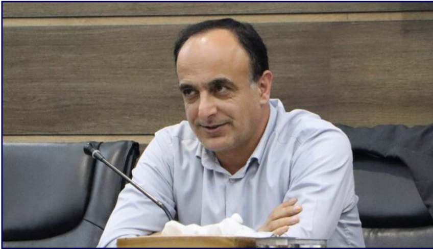
طرح نو؛ گروه خبر

جوی افزود: برگزاری نشست‌های منظم با نمایندگان خانه صنعت و معدن و ایجاد پلتفرم‌های مشترک برای انتقال دانش و تجربیات، از جمله اقداماتی است که در دستور کار قرار گرفته است.