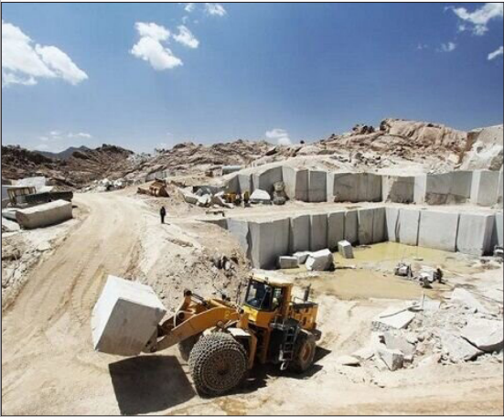
طرح نو؛ گروه گزارش

آذربایجان غربی با استخراج سالانه بیش از ۱۸ میلیون و ۸۰۹ هزار تن انواع مواد معدنی مختلف یکی از استان‌های مهم کشور در زمینه ذخیره و تنوع مواد معدنی است.