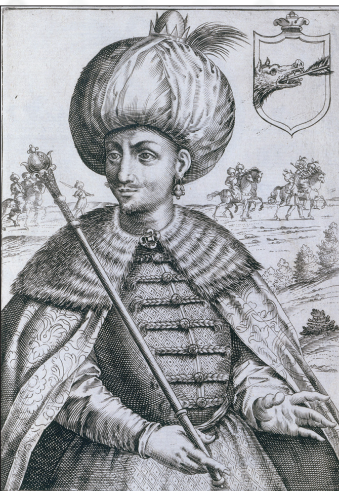
SCHIAC APPAS RE DI PERSIA نگاره شاه عباس (۱۵۹۶) میلادی اثر جیاکومو فرانکو

شاه عباس، پنجمین پادشاه ایران صفوی بود که از سال ۱۵۸۷ تا ۱۶۲۹ میلادی به مدت ۴۱ سال حکومت کرد. او هنگامی به سلطنت رسید که غرب و شمال غربی ایران از جمله آذربایجان در تصرف امپراتوری عثمانی بود؛ خراسان و شمال شرق ایران تحت اشغال ازبک‌ها بود؛ قدرت شاه کاهش پیدا کرده بود؛ و دوگانگی میان قزلباشان ترکمان و تاجیکان در دربار شدت پیدا کرده بود. او نخست ازبکان را شکست داده و از خاک ایران عقب راند و سپس در چندین نوبت با عثمانی‌ها جنگید و مناطق اشغالی را آزاد کرد