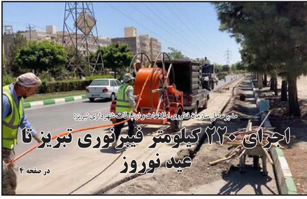
ملکیرحامل سازمان فناوری اطلاعات و ارتباطات شهرداری تبریز: