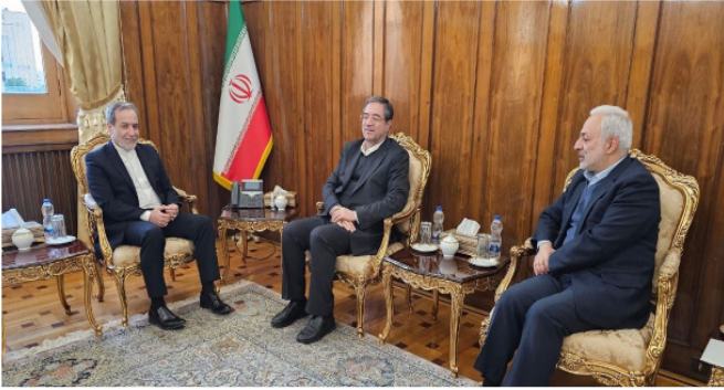
طرح نو؛ گروه خبر

رضا رحمانی استاندار آذربایجان غربی و سیدعباس عراقچی وزیر امور خارجه با یکدیگر دیدار و گفت‌وگو کردند.