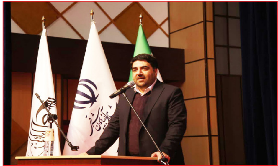
طرح نو؛ گروه فرهنگ و هنر مدیرکل فرهنگ و ارشاد اسلامی آذربایجان‌شرقی گفت: قریب به ۵۰ درصد اجراهای صحنه‌ای موسیقی در

وی با اشاره به جشنواره‌های مختلف فرهنگی و هنری از آغاز ماه بهمن در استان، گفت: استقبال هنری نسبت به چندسال گذشته جهشی افزایش یافته و چنین دورانی در عرصه هنر بی‌سابقه بوده است. بهمن‌ماه با جشنواره عاشیقی‌ها شروع شد سپس با جشنواره موسیقی فجر استان و حضور پررنگ مردم ادامه یافت که مطمئنم بهترین جشنواره خواهد شد. همچنین شاهد اجراهای