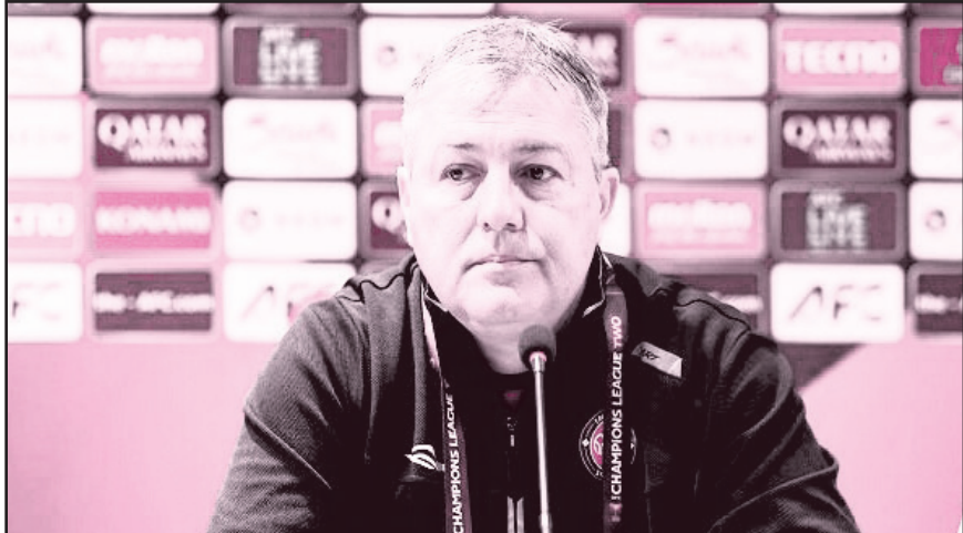
طرح نو؛ گروه ورزش سرمربی تیم فوتبال تراکتور تبریز با بیان اینکه

نیمه اول بازی بی‌نقص داشتیم ، گفت: در نیمه دوم بسیار ساده لوحانه گل خوردیم و باید کنترل بازی بعد از برتری را تمرین کنیم. درآگان اسکوچیچ شامگاه سه شنبه در نشست پس از بازی با الخالدیه بحرین با ابراز خوشالی از صعود تیم به مرحله بعد و اینکه هواداران خوشحال رفتند، گفت: دوست داشتم برد با صعود باشد اما نشد. وی افزود: شرمند مردم شدیم اما چون صعود کردیم خیلی خوشحالم و به بازیکنان و کادرفنی و هواداران تبریک می گویم. اسکوچیچ در مورد مصدومیت ریکاردو آلوز با اعلام اینکه آزمایشات اولیه انجام شده است و آسیب دیدگی شدید نیست، گفت: ضربه به زانوی این بازیکن وارد شده و در چهل و هشت ساعت