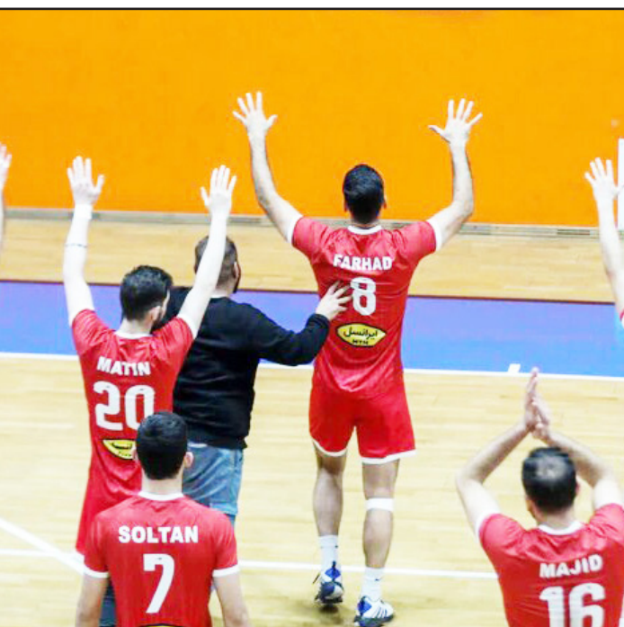
تیم در لیگ برتر شنیده شد و بمب خبری از سوی این باشگاه پس از تغییرات مدیریتی، نوید معجزه ای برای ورزش والیبال استان داشت.