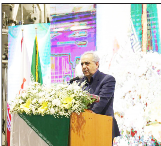
طرح نو؛ سردبیر