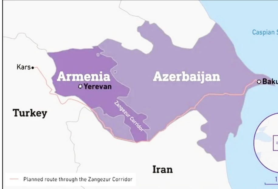
Planned route through the Zangezur Corridor

طرح نو، گروه سیاست حملات اخیر روسیه به زیرساخت‌های شرکت دولتی نفت جمهوری آذربایجان (SOCAR) در بندر اودسا، تقابل ژئوپلیتیک میان مسکو و باکو را به شکل خطرناکی تشدید کرده است. این حملات که منجر به انهدام کامل یک پایانه بزرگ نفتی شد، اوج یک کارزار نظامی هدفمند بود که منافع اقتصادی باکو در اوکراین را هدف قرار داده است. این رویدادها، جنگ اوکراین را به صحنه جدیدی برای تسویه حساب‌های منطقه‌ای تبدیل کرده و هر دو طرف روایت‌های کاملاً متضادی از آن ارائه می‌دهند. این حمله یک رویداد ناگهانی نبود، بلکه بخشی از یک الگوی تهاجمی دقیق بود. این زنجیره حملات شامل موارد زیر است: ۱۵ ژوئن ۲۰۲۵: حمله به پالایشگاه نفت کرمینوگ که نفت باکو را فرآوری می‌کرد. ۳۰ ژوئن ۲۰۲۵: هدف قرار دادن پالایشگاه دروگوبیچ کارکرد مشابه. ۶ اگوست ۲۰۲۵: حمله به ایستگاه کمپرسور گاز اورلولا، که برای انتقال گاز باکو به اوکراین حیاتی بود.