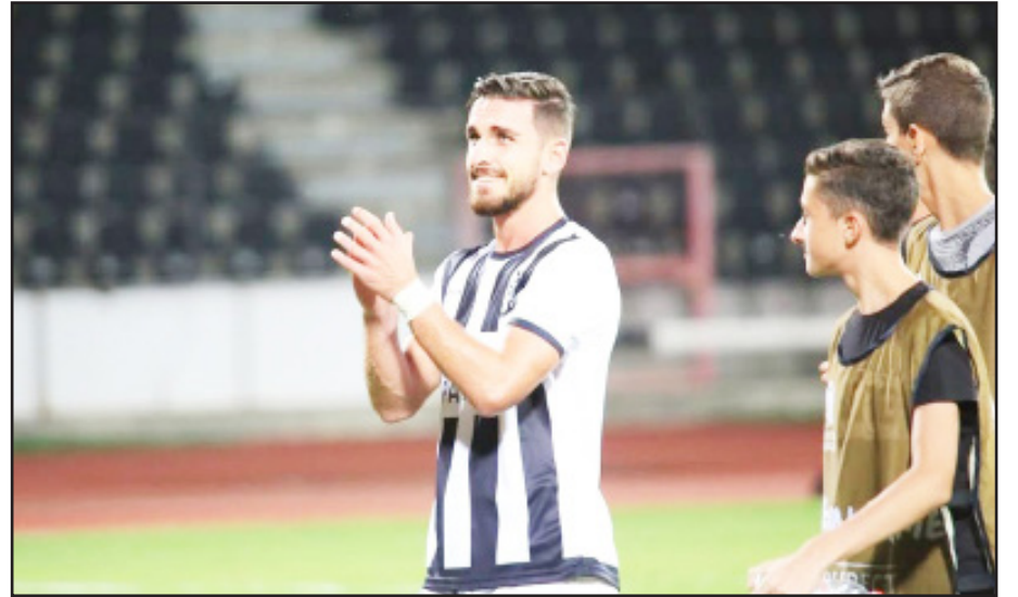
طرح‌نو؛ گروه ورزش