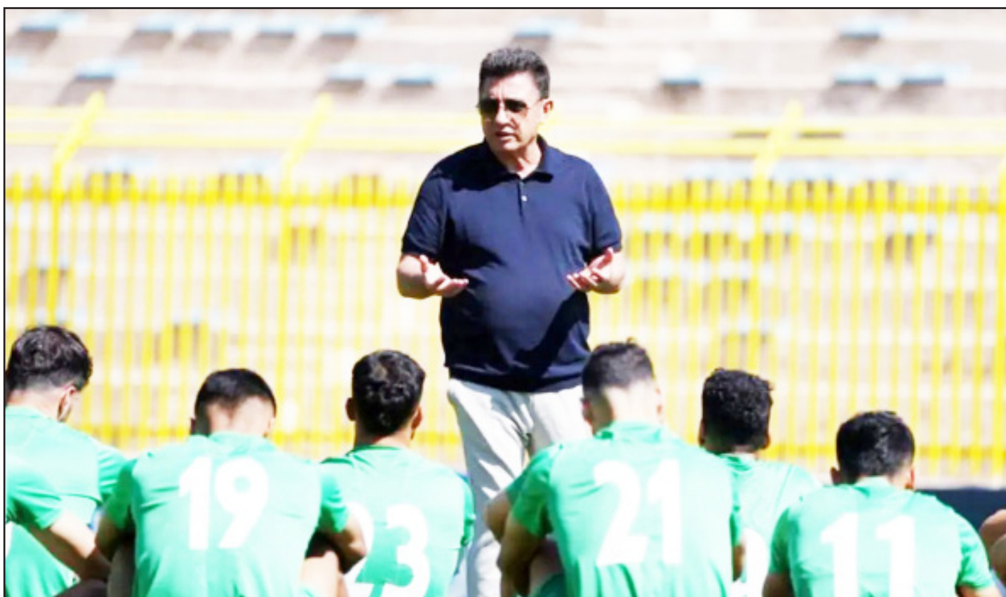
طرح نو؛ گروه ورزش

لیست تیم ملی برای حضور در تورنمنت کافا در شرایطی نهای شده که چهره‌های سرشناسی در فهرست جدید نام‌شان دیده نمی‌شود.