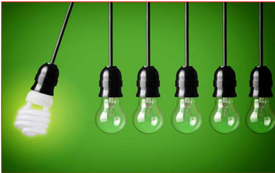
وابستگی به منابع خارجی و حفاظت از محیط زیست را تضمین می‌کند. این یک تصمیم اقتصادی و فرهنگی است که نسل‌های آینده را از بحران‌های زیست‌محیطی نجات می‌دهد.