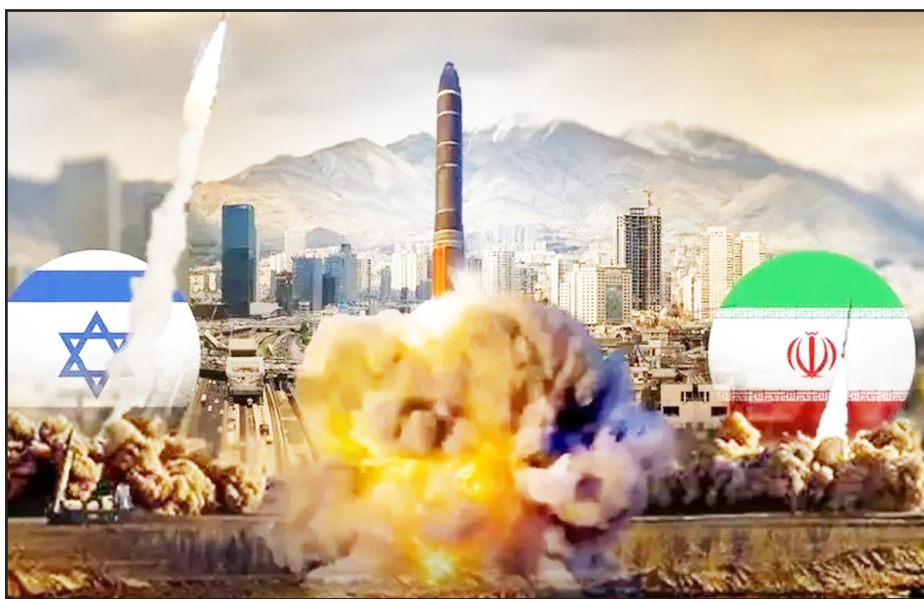
افکار عمومی داخل را درگیر زلزله و تردید کند. اما هیچ‌کدام از این اهداف محقق نشد. زیرساخت‌های اصلی نظامی و حیاتی کشور پابرجا ماند، پاسخ ایران به‌صورت متقارن و هدفمند انجام شد، و در نهایت

طرح نو، سردبیر دوازده روز نبرد مستقیم و پرتنش میان ایران و ائتلاف نظامی آمریکا و رژیم صهیونیستی، با تمام پیچیدگی‌ها، تلفات و خسارات متقابل، اکنون وارد فاز «آتش‌بس شکننده» شده است. بسیاری از ناظران بین‌المللی در تلاشند تا از دل آمار، نقشه‌ها و تحلیل‌های اطلاعاتی، نتیجه این جنگ کوتاه اما شدید را روشن کنند؛ اما حقیقت اینجاست که در جنگ‌های مدرن، پیروزی فقط به معنای اشغال سرزمین یا نابودی نیرو نیست. پیروزی یعنی رسیدن یا نرسیدن به اهداف راهبردی. و اگر از این زاویه به جنگ ۱۲ روزه بنگریم، ایران را می‌توان بی‌تردید پیروز واقعی این نبرد دانست.