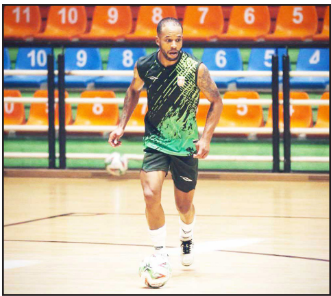
طرح نو؛ گروه ورزش

با وجود اینکه باشگاه مس سونگون، تمامی پول رضایت نامه کارلوس سانز را پرداخت کرده، اما همچنان آی‌تی‌سی ستاره ونزوئلایی صادر نشده است