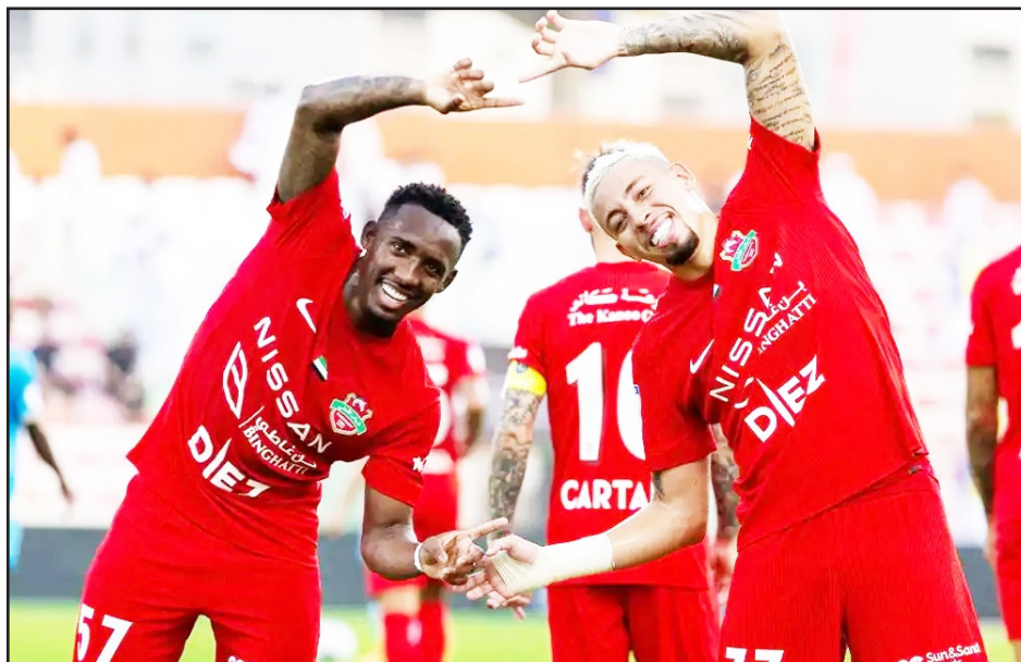
به میدان می آید، صف آرایی کنند که این مسابقه فردا آل راشد شهر دبی به انجام خواهد رسید و کاروان تراکتور برای انجام این مسابقه عازم امارات شده است. (سه شنبه) از ساعت ۱۹:۳۰ به وقت ایران در ورزشگاه

و یک تساوی تومان با ثبت ۳ گل و ثبت ۳ گلین شید بیایی باعث شده تا شباب الاهلی صدرنشین فصل جدید لیگ برتر امارات هم باشد و فرم خوب خود را حفظ کند. فرم درخشان پسران سوسا؛ به دنبال جبران یک ناکامی شباب الاهلی که فصل گذشته در سطح دوم لیگ قهرمانان آسیا حضور داشت و در مرحله یک چهارم نهایی مغلوب شارجه شد و از گردونه رقابت ها کنار رفت، حالا عزم راسخی برای موفقیت در لیگ نخبگان آسیا دارد و هدف نخست شاگردان پائولو سوسا، صعود از مرحله گروهی است که این راه، سرخ پوشان شهر دبی امید دارند بتوانند رودررو نخواستند که این مسئله بی شک می تواند راه صعود از مرحله گروهی را برای تی تی ها هموار کند. شاگردان دراگان اسکوچیچ در نخستین گام از مرحله گروهی لیگ نخبگان آسیا باید یکی از سخت ترین بازی های خود در این مرحله را به انجام برسانند؛ چرا که میهمان شباب الاهلی هستند و باید برابر قهرمان فصل گذشته لیگ برتر امارات که تحت هدایت پائولو سوسا