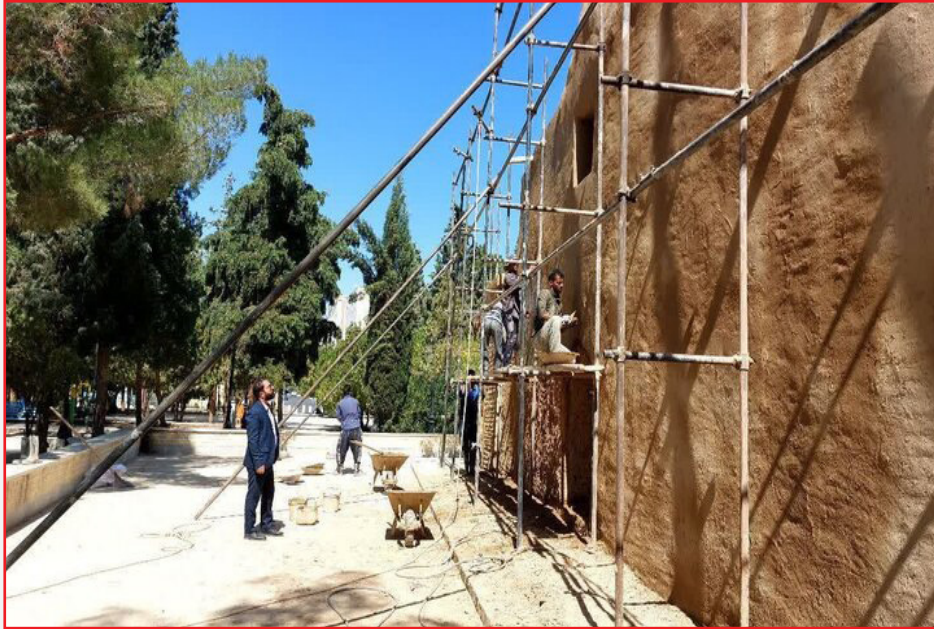
۵۲ طرح گردشگری در آذربایجان غربی اجرا می شود