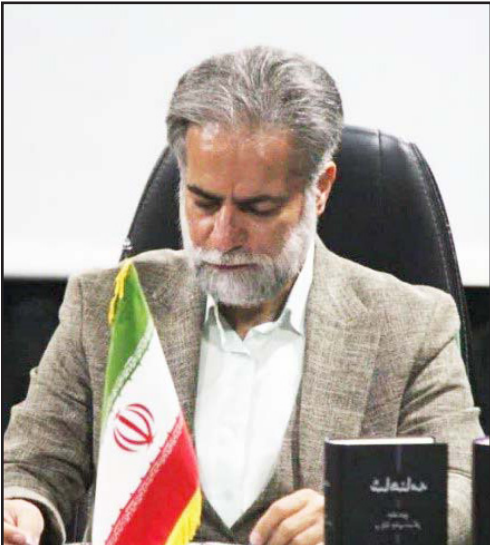
طرح نو؛ جمشید پوراسمعیل نیازی بخش اول...

شمس تبریزی، شخصیتی چندوجهی بود که اندیشه‌هایش، عمیقاً در بستر تاریخ، فرهنگ و معنویت ایران ریشه داشت. او تجسمی از روح پرسشگر، حقیقت‌طلب و آزادی‌خواهی بود که همواره در تار و پود فرهنگ ایرانی تنیده شده است. شمس، در «مقالات»، به موضوعاتی چون عشق الهی و انسانی، معرفت نفس، خودشناسی، اخلاق فردی و اجتماعی، و رابطه انسان با خداوند می‌پردازد. اما در بطن تمام این مباحث، نگاهی انسانی و تأکید بر کرامت نفس و ارزش وجودی انسان، که از دیرباز در فرهنگ ایرانی مورد توجه بوده، به وضوح مشاهده می‌شود. او در دنیایی که گاه انسان‌ها در بند ظواهر و تقلیدهای کورکورانه گرفتار آمده بودند، انسان را به بازگشت به خویشتن، کشف گوهر وجودی و رسیدن به حقیقت از طریق