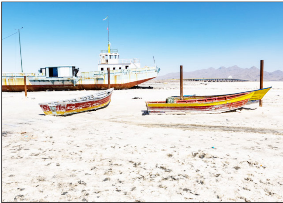
معیشت جایگزین ایجاد کرد.

دبیر علمی کارگروه ملی نجات دریاچه ارومیه نیز با اشاره به اینکه با وجود سرمایه گذاری سنگین، شاهد اضمحلال منابع آبی منطقه هستیم، بر ضرورت به روز رسانی نقشه احیای دریاچه و ایجاد ردیف بودجه