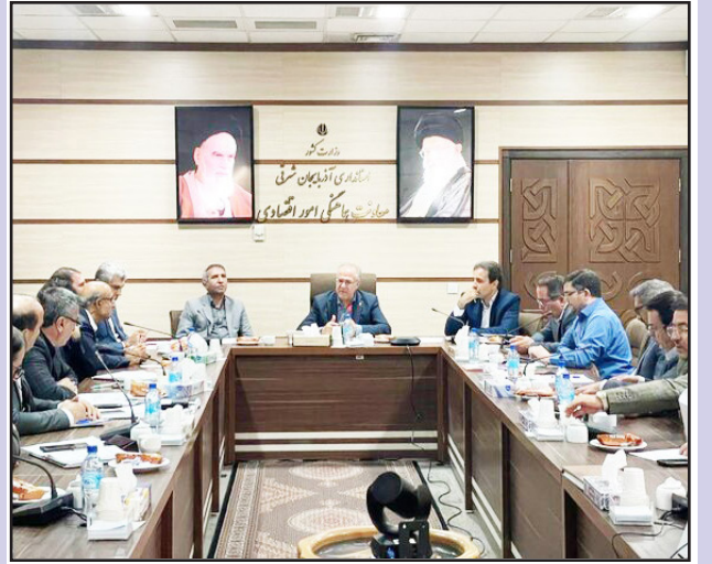
طرح نو، گروه خبر

معاون هماهنگی امور اقتصادی استاندار آذربایجان شرقی با تأکید بر اینکه کیفیت کالاهای اساسی باید در کنار کمیت ارتقا یابد، گفت: ذخایر کالاهای اساسی استان در وضعیت مطلوبی قرار دارد.