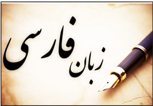
طرح نو؛ سردبیر

زبان، شریان حیاتی یک ملت و اصلی‌ترین بستر انتقال فرهنگ، تاریخ و هویت در طول اعصار است. در میان ملت‌های جهان، برخی کشورها دارای یک زبان محوری هستند که هم در ساختار هویتی و فرهنگی (زبان ملی) و هم در تنظیم مناسبات حکومتی و اداری (زبان رسمی) نقشی بنیادین ایفا می‌کند. ایران از جمله معدود کشورهایی در جهان است که چنین یگانگی زبانی را تجربه می‌کند؛ جایی که زبان فارسی، پیونددهنده عمیق گذشته تاریخی با حال و آینده است. با این حال، برای درک عمق این جایگاه، لازم است ابتدا تمایز دو مفهوم «زبان ملی» و «زبان رسمی» مورد بررسی قرار گیرد.