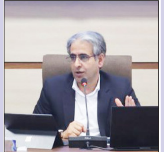
طرح نو، گروه خبر

معاون سیاسی اجتماعی استاندار آذربایجان شرقی با بیان اینکه به فرمانداری‌ها مأموریت دادیم، خانواده‌های بی‌بضاعت را شناسایی و پشتیبانی کنند گفت: حمایت از دهک‌های پایین در دستور کار استانداری قرار دارد.