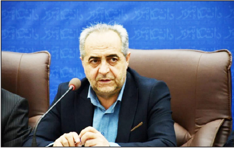
طرح نو؛ گروه خبر

استاندار آذربایجان شرقی با بیان اینکه خیران، صنایع و دانشگاه‌ها و اتاق بازرگانی تبریز پای کار توسعه استان هستند، به دانشگاه‌های استان برای احیای مکتب تبریز مأموریت داد. بهرام سرمست امروز در «نشست تخصصی ارتباط دانشگاه با جامعه و صنعت» با حضور معاون علمی، فناوری و اقتصاد دانش بنیان رئیس جمهور، با اشاره به مأموریت استانداری برای پیوند اضلاع مثلث علم، صنعت و جامعه اظهار داشت: ما در استانداری، برای دانشگاه‌ها مأموریت‌هایی ویژه در ارتباط با صنعت و جامعه تدوین کرده‌ایم. به‌عنوان نمونه، در دانشگاه تبریز به‌دنبال تقویت «مکتب تجاری تبریز» هستیم و اگر اتاق بازرگانی و دانشگاه تبریز بتوانند این مکتب را توسعه دهند، پیوندی مستحکم میان صنعت و دانشگاه ایجاد خواهد شد. سرمست افزود: ما درصدد هستیم با کمک دانشگاه هنر، مکتب فرش تبریز را احیا کنیم. از معاونت علمی ریاست جمهوری انتظار داریم، برای حمایت از صنعت فرش تبریز و صنعت تابلوفرش سردرود، از دانشگاه هنر به صورت ویژه پشتیبانی کند.