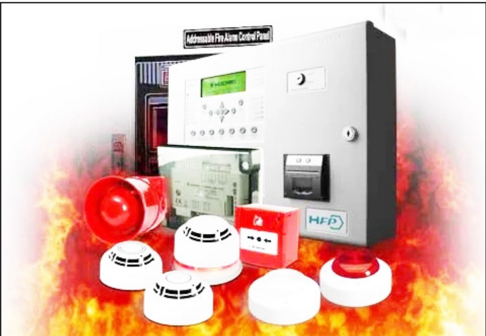
سیستم منابع آب به حساب آورد

جعبه آتش نشانی دیواری: این نوع از باکس دارای دو نوع توکار و روکار تقسیم می‌شود. جعبه روکار آتش نشانی: در مکان های که امکان نصب درون کار از قبل مشخص نشده باشد از باکس های روکار استفاده می‌شود. جعبه توکار آتش نشانی: در ساختمان های جدید ساخت که برای این باکس مکان های درون کار قرار داده شده است از این نوع استفاده می‌شود. جعبه آتش نشانی محوطه ای: این نوع در یک مدل پایه دار و به صورت ایستاده وجود دارد. جعبه آتش نشانی از لحاظ کاربرد جعبه نگهداری کپسول آتش نشانی: این باکس محفظه ای است که کپسول آتشنشانی درون آن قرار می‌گیرد. جعبه کپسول آتش نشانی: درون این باکس شیلنگ های متفاوتی قرار می‌گیرند که به صورت کلی می‌توان آن را به دو نوع تقسیم کرد (فایرباکس و هوزریل باکس) جعبه شیلنگ آتش نشانی هر دو سیستم بیان شده در بالا (هوزریل و فایرباکس) یکی از تجهیزات پر کاربرد است که آنها را می‌توان جزء