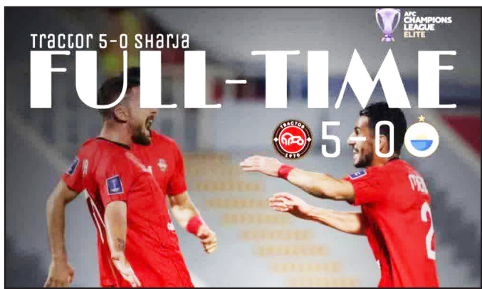
طرح‌تو؛ یونس نهاری

تراکتور در ورزشگاه اختصاصی شارجه امارات، در چارچوب هفته سوم لیگ نخچگان آسیا، نمایشی خیره‌کننده و فراموش‌نشدنی ارائه داد و موفق شد میزبان قدرتمند خود را با نتیجه پرگل ۵ بر صفر درهم بکوبد. این برد قاطع، نه تنها یک پیروزی مهم بود، بلکه به منزله یک بیانیه قوی از سوی شاگردان دراگان اسکوچیچ در سطح قاره آسیا تلقی می‌شود. طوفان زودهنگام و بهره‌وری بالا: