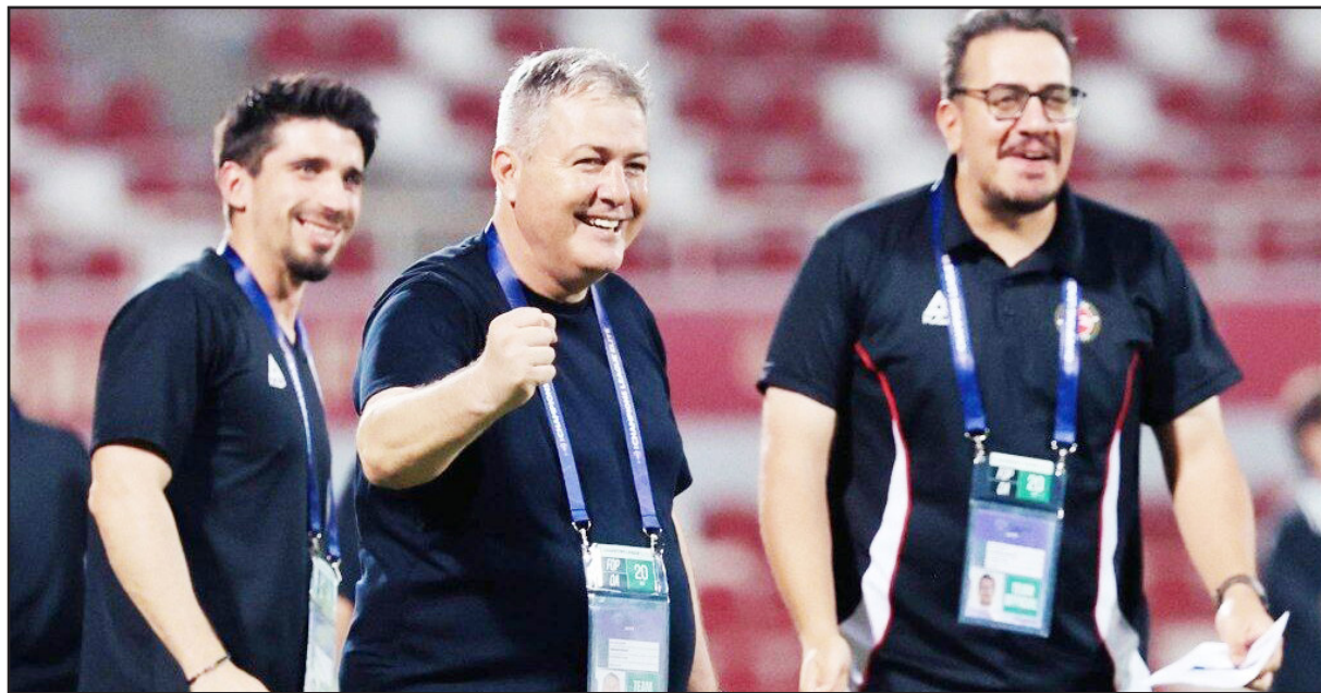
صفر شکست دهد.