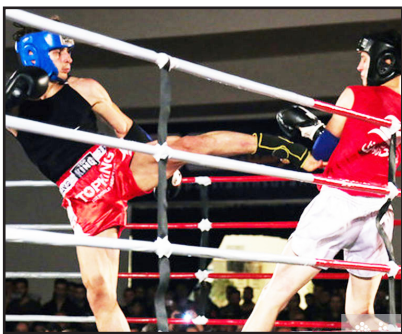
طرح‌نو؛ گروه ورزش

رزمی‌کار آذربایجان شرقی در مسابقات کبیدی، به عنوان یکی از شش داور اعزامی ایران در مسابقات آسیایی جوانان