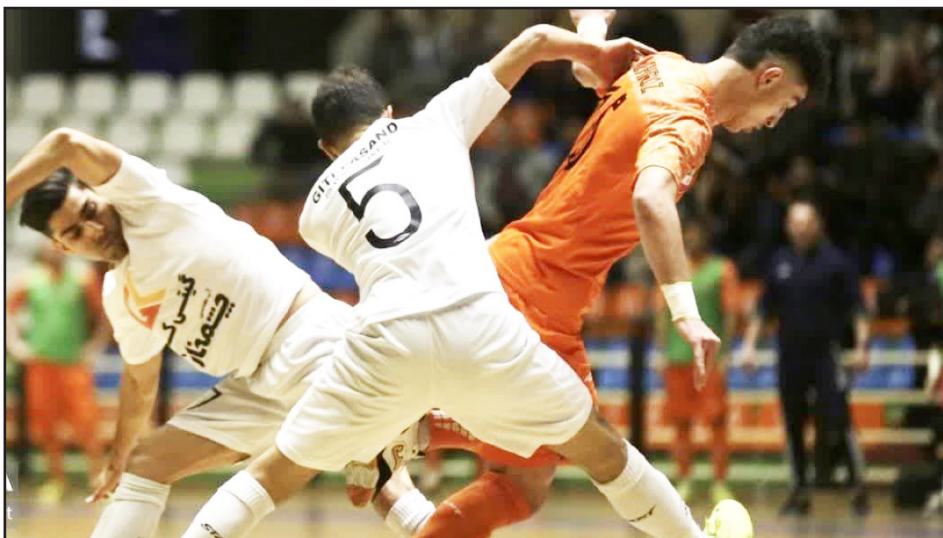
۴ گل برای هر بازی عنوان بهترین خط حمله لیگ را در اختیار دارد. در عین حال، دریافت ۲۲ گل با میانگین تقریباً ۲ گل خورده برای هر بازی نشان می‌دهد که این تیم در فاز

طرح‌نو؛ گروه ورزش تیم فوتسال مس سونگون ورزشان در پایان نیم‌فصل اول لیگ برتر در جایگاه دوم ایستاد و نصف رقابت قهرمانی را به رقیب سنتی خود واگذار کرد.