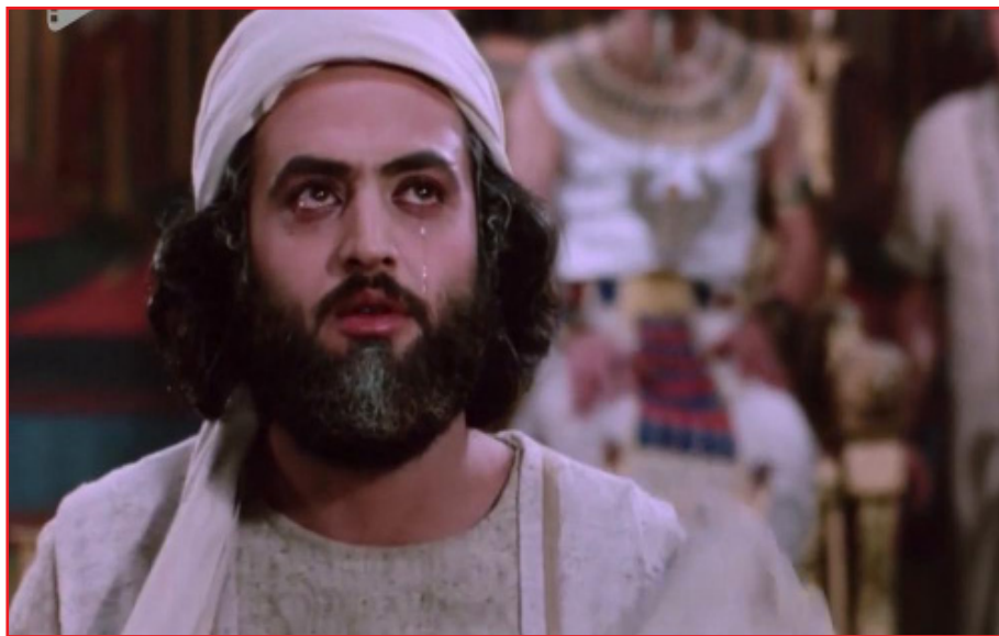
وقتی با این ضد قهرمان ها مواجه می شود، امداد غیبی می گیرد و برکت بر او نازل می شود و به مقام نبوت می رسد و می تواند مردم را نجات دهد. اساساً در داستان