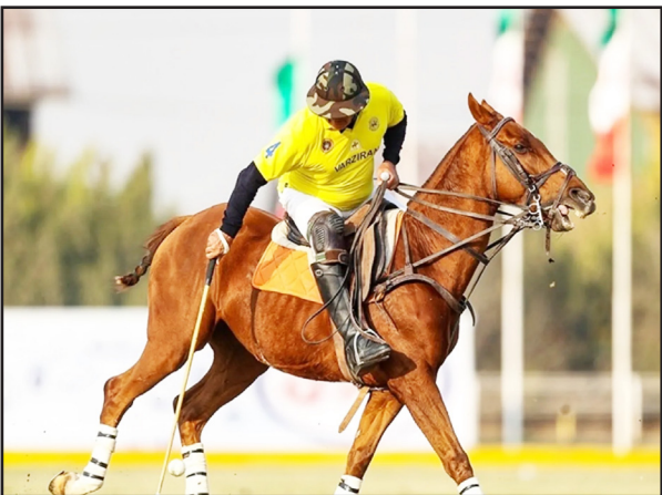
طرح نو؛ گروه ورزش