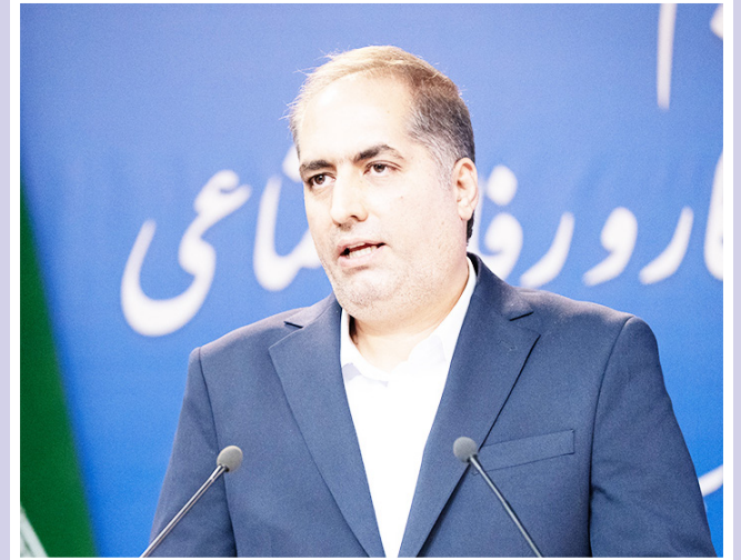
طرح نو؛ گروه خبر

مدیرکل جدید تعاون، کار و رفاه اجتماعی آذربایجان شرقی در آیین معارفه خود تأکید کرد: استفاده بهینه از ظرفیت‌های صنعتی و انسانی استان، ارتقای مهارت نیروهای کار، حمایت از کارگران و کارفرمایان و توسعه تعاونی‌ها از اولویت‌های اصلی برنامه‌های اداره کل خواهد بود.