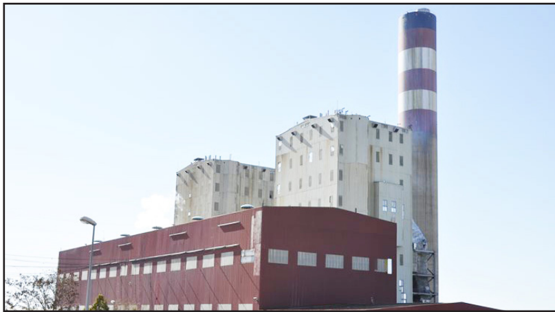
صبا انرژی، عملیات اجرایی آن در سه ماه آینده آغاز شود.

نیروگاه تبریز دارای ۲ واحد بخار هر کدام به ظرفیت ۳۶۸ مگاوات (با قدرت تولید عملی ۳۵۰ مگاوات) است.