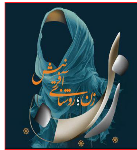
طرح نو؛ گروه فرهنگ و هنر

به مناسبت میلاد مبارک حضرت فاطمه زهرا(س) و گرامی داشت مقام زن؛