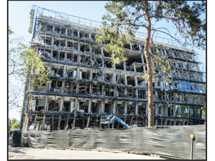
طرح نو؛ سردبیر

حملات انبوه و مهندسی اجتماعی برای نفوذ به لایه‌های انسانی سیستم است. تکان‌دهنده‌ترین بخش از اعترافات کارادی، مربوط به رویدادی مشخص در جنگ ۱۲ روزه (عملیات «نگهبان دیوارها» در ماه ژوئن) است. وی فاش کرد که ایران هنگام اصابت موشک بالستیک به مؤسسه تحقیقاتی «وایزمن»، لحظاتی پیش از برخورد، موفق شده بود کنترل یک دوربین خیابانی ساختمان را به دست بگیرد. این جزئیات، روایتی فراتر از نفوذ ساده است و سه نکته کلیدی را مشخص می‌سازد: