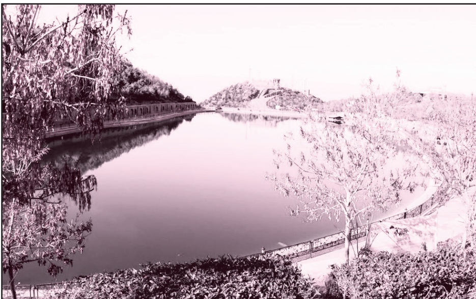
محل تأمین می‌شود.

وی در تشریح نخستین بازدید از گلخانه‌های عینالی گفت: سه واحد گلخانه‌ای فعال در این مجموعه با ظرفیت تولید ۱۱۰ هزار بوته گل مشغول فعالیت هستند. مجموع مساحت گلخانه‌های عینالی ۱۴۰۰ مترمربع است و بخش قابل توجهی از نیاز گل و گیاه فضاهای سبز شهری از این