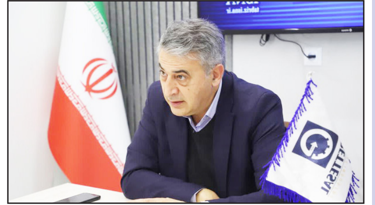
طرح نو: گروه اقتصاد

رییس کمیسیون صنایع، انرژی و احداث اتاق بازرگانی از وضعیت اقتصادی واحدهای تولیدی انتقاد کرد و گفت: اگر اقتصاد کشوری قدرتمند باشد، سیاست آن نیز قدرتمند می‌شود، ولی متأسفانه همواره در کشور ما، سیاستمداران، صنعت را فدای سیاست کرده‌اند.