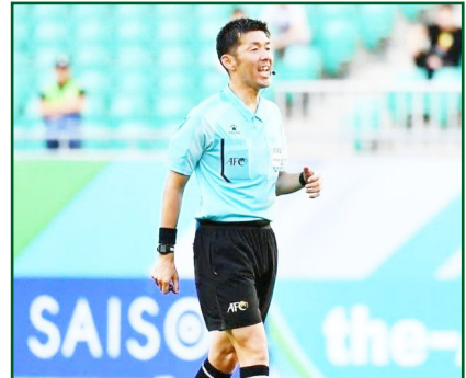
بازی دوشنبه شب که اولین قضاوت او برای تراکتور است چه خواهد شد و در پایان چه نتیجه ای روی اسکرین برد ورزشگاه یادگار امام نقش می بندد.

زده است. در دور دوم مقدماتی جام جهانی، او دیدار ایران و ترکمنستان را که با پیروزی قاطع ۵ بر صفر ملی پوشان ایرانی همراه بود، قضاوت کرد. در دور سوم مقدماتی جام جهانی نیز آراکی در دو مسابقه ایران، یکی مقابل قرقیزستان که با برتری ۱ بر صفر ایران همراه شد، و دیگری مقابل قطر که با برد ۴ بر ۱ ملی پوشان خاتمه یافت، داور میدان بود. به جز این مسابقات، آراکی سابقه قضاوت در دیگر رقابت های آسیایی را نیز دارد. او در لیگ قهرمانان آسیا، دیدار بین نساجی مازندران و نوبهار ازبکستان را قضاوت کرده؛ مسابقه ای که با شکست ۳ بر ۱ نماینده ایران درخشش استون اورونوف، ستاره ازبکی، همراه بود. حالا این داور برای نخستین بار در لیگ نخبگان آسیا یک مسابقه تراکتور را سوت خواهد زد و باید دید سرنوشت