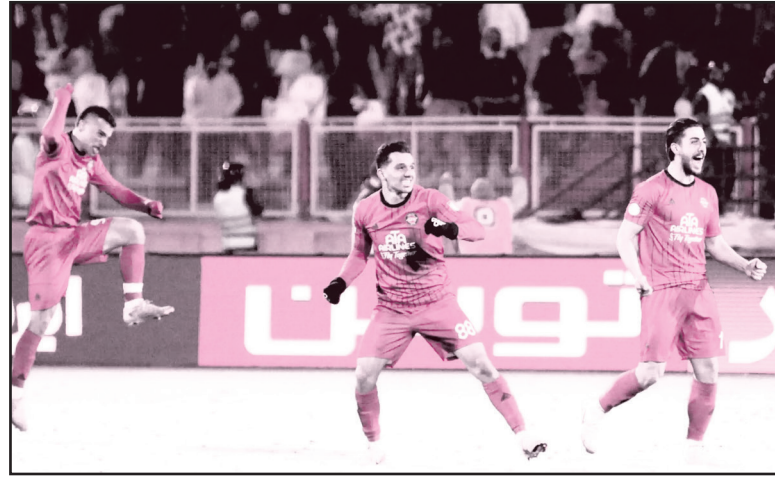
راه صعود تراکتور بسیار هموار است

تراکتوری‌ها که در بازگشت به ورزشگاه یادگار امام تبریز توانستند در حضور پرشور هواداران خود مقابل پرسپولیس جشن پیروزی بگیرند، حالا برای یک رویارویی مهم دیگر در این ورزشگاه آماده می‌شوند؛ جدال با الدحیل قطر. برحسب شرایط جدولی، تراکتور حتی با کسب نتیجه تساوی هم می‌تواند صعودش به مرحله حذفی لیگ نخیکنگان آسیا را ۲ هفته مانده به پایان مرحله گروهی مسجل کند و حتی در صورت ثبت فعل و انفعالاتی، تی‌تی‌ها فرصت راهیابی به مرحله بعدی با قبول شکست مقابل الدحیل را هم دارند اما هدف شاگردان اسکوچپ، تداوم