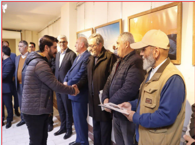
طرح نو؛ گروه فرهنگ و هنر، به کار خود پایان داد.

گفتنی است؛ انجمن سینمای جوانان دفتر مراغه با بیش از پنج دهه فعالیت مستمر، از قدیمی‌ترین مراکز آموزش فیلم‌سازی و عکاسی در کشور به‌شمار می‌رود و همچنان در تربیت و پرورش نسل‌های تازه‌ای از هنرمندان این عرصه نقش‌آفرینی می‌کند.