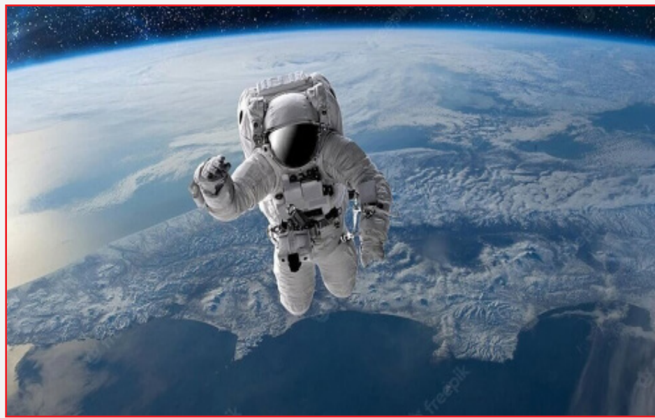
بر ذهنیت بشری می‌پردازیم.

تأثیرات فرهنگی سفر به فضا سفر به فضا به ما این امکان را می‌دهد که زمین را از فاصله‌ای دورتر ببینیم و آن را به عنوان یک سیاره منحصر به فرد در میان بی‌نهایت ستاره‌ها و کهکشان‌ها درک کنیم. دیدگاه جدیدی که از این منظر به وجود می‌آید، باعث می‌شود تا بسیاری از ما به اهمیت حفظ محیط زیست و همبستگی جهانی پی ببریم. تصاویر مشهور «زمین آبی» که توسط فضانوردان گرفته شده‌اند،