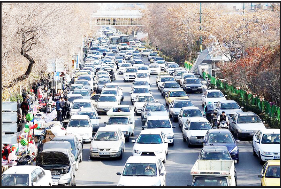
فیزیکی معابر یا افزایش مقطعی ظرفیت ترافیکی می‌باشد.

وی می‌افزاید: شهر تبریز از نظر میزان استفاده شهروندان از ظرفیت خیابان‌ها، رتبه نخست دنیا را دارد؛ این در حالی است که طی سال‌های اخیر تعداد خودروها حدود دو و نیم برابر شده، اما زیرساخت‌های ترافیکی و وسعت معابر به‌روزرسانی و توسعه متناسبی نداشته‌اند.