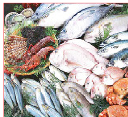
آذربایجان غربی و ۵ استان کشور را تأمین می‌کند.