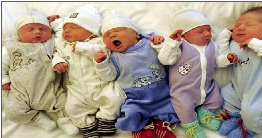
وی ادامه داد: بر اساس این آمار به ازای هر ۱۰۰ دختر، ۱۱۰ پسر در آذربایجان غربی متولد شده‌اند که