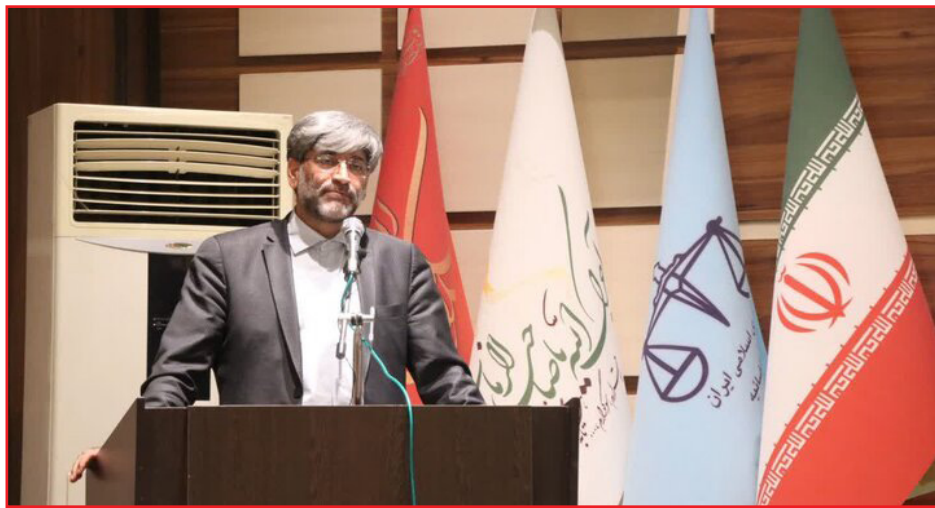
استاندار آذربایجان غربی نیز با تأکید بر نقش کلیدی اصناف و بازاریان در اقتصاد مردمی گفت: اصناف ستون فقرات معیشت جامعه هستند و ثبات بازار، تأمین به موقع کالاهای اساسی و آرامش اقتصادی بدون همراهی و مشارکت جدی آنان امکان پذیر نیست. رضا رحمانی، با اشاره به ضرورت مدیریت جهادی و تمام وقت مسئولان، اظهار کرد: کسی که در جمهوری اسلامی مسئولیت می پذیرد، نباید برای خدمت به مردم تعطیلی قائل شود؛ چرا که پاداش واقعی این مسیر، رضایت

طرح نو؛ گروه خبر رییس کل دادگستری آذربایجان غربی گفت: بازاریان باید اجازه ندهند افراد فرصت طلب و نفوذی خارج از بازار، میدان داری کنند. بیان اینکه غالب اصناف و بازاریان خود را جان فدا می دانند، گفت: مسئولیت پذیری، نوع دوستی و روحیه انقلابی بازاریان استان همانند روزهای نخست انقلاب است.