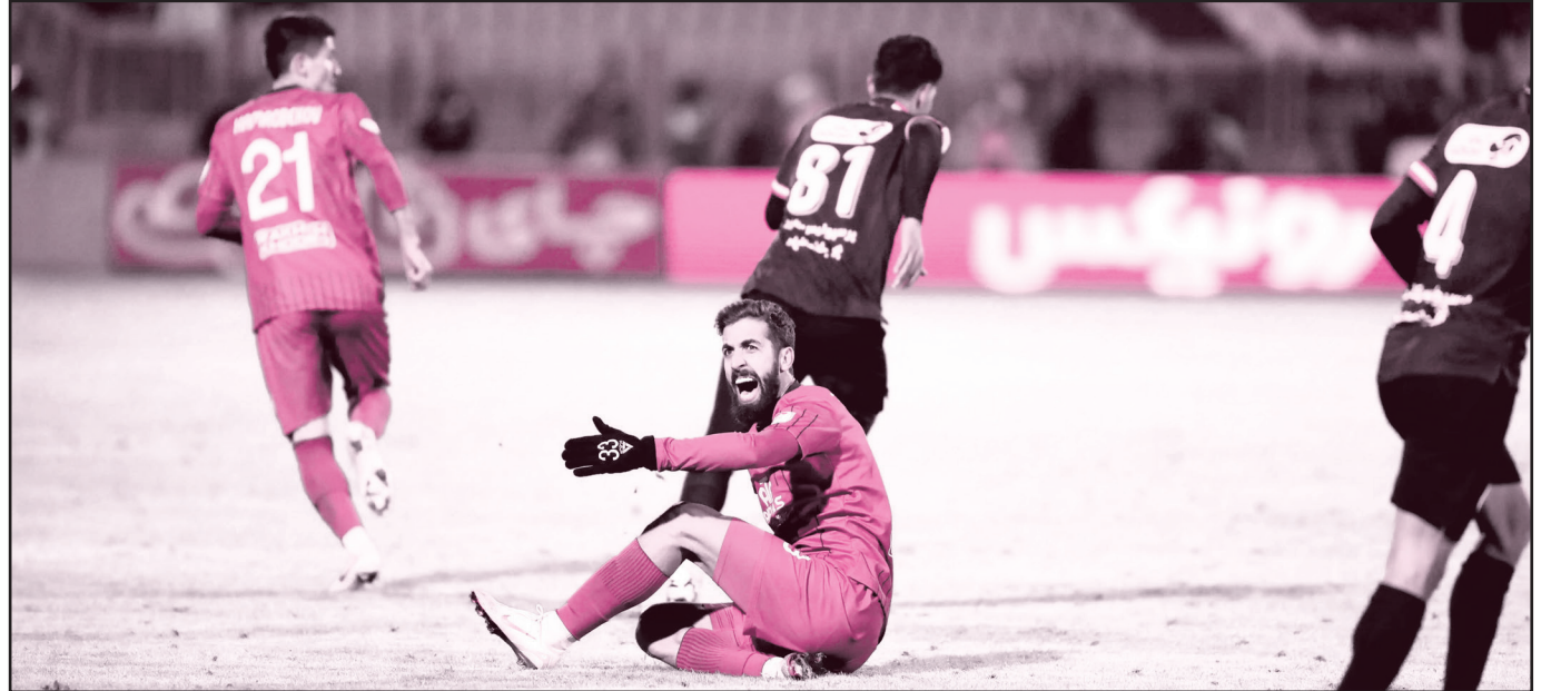
طرح نو؛ گروه ورزش