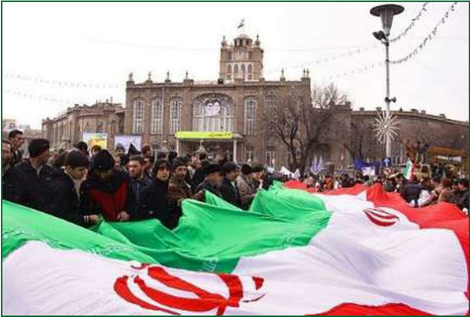
قانونی رسیدگی به مشکلات گردید.

نشان دهند. اما این سیاست رسانه‌ای با واکنش‌های منطقی و آگاهانه مردم و مسئولان مواجه شده و به زودی ماهیت واقعی خود را از دست داد. در مقابل، رسانه‌های داخلی وظیفه دارند با ارائه تحلیل‌های دقیق، منصفانه و مستند، به بازتاب واقعیت‌ها بپردازند و اجازه ندهند این گونه شایعات و تحلیل‌های غلط موجب خدشه به وحدت و انسجام ملی شود. از طرفی برخورد مسئولانه و هوشمندانه مردم آذربایجان در فاصله گرفتن از اغتشاشات، یک درس بزرگ برای کل کشور بود درباره اهمیت بصیرت سیاسی، شناخت دشمنان داخلی و خارجی و تلاش در جهت حفظ اتحاد ملی.