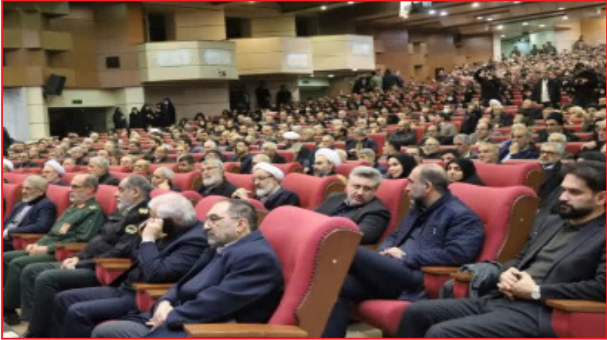
جنگ حق و باطل در طول تاریخ، تصریح کرد: ملت ایران در تمامی مقاطع حساس انقلاب، از جمله هشت

آرمان‌های انقلاب و رهبری را به اثبات رسانده‌اند. وی همچنین با تأکید بر شکست دشمنان در جنگ تحمیلی، فتنه داعش و تجاوز اخیر صهیونیست‌ها، افزود: با رهبری حکیمانه مقام معظم رهبری و وحدت، انسجام و مقاومت ملت، جمهوری اسلامی ایران همیشه سربلند و پیروز بوده است. سردار عباسقلی‌زاده در بخش دیگری از سخنان خود به همراهی ارزشمند اصناف، بازاریان و اتحادیه‌های استان اشاره و بیان کرد: بیانیه اخیر بازاریان آذربایجان شرقی، که الگویی برای سایر استان‌ها شد، نماد بارز نقش آفرینی آنان در ایجاد آرامش و بیان منطقی مطالبات مردم است. وی در پایان با قدردانی از تلاش‌های این قشر، تأکید کرد: «بازاریان و اصناف استان همواره پرچمدار وحدت، انسجام ملی و حمایت از انقلاب بوده‌اند و نقش مهمی در پایداری امنیت و آرامش اجتماعی دارند. / مهر