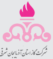
شرکت گاز استان آذربایجان شرقی

در مجموع، تراکتور برای بازگشت به جمع مدعیان قهرمانی در نیم‌فصل دوم، چاره‌ای جز استفاده حداکثری از فرصت‌ها ندارد، مخصوصاً در دیدار برابر تیم‌های پایین‌جدولی که امتیاز از دست دادن مقابل آن‌ها، می‌تواند مسیر سرخ‌پوشان در راه فتح دوباره جام را بیش از پیش منحرف کند.