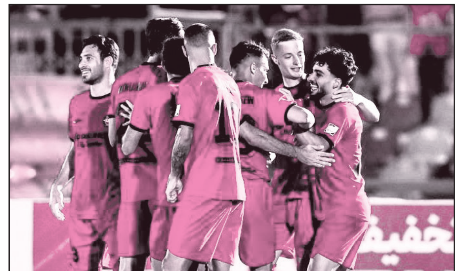
طرح نو؛ گروه ورزش

مدافع عنوان قهرمانی لیگ برتر فوتبال در نیم‌فصل اول آمار عجیبی مقابل تیم‌های پایین جدولی به ثبت رسانده است.