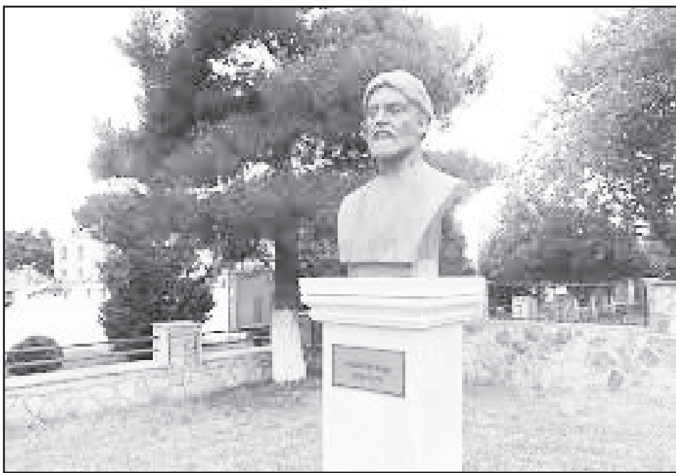
پر زر کانی و پر گوهر مکنون ن‌کند

رهایمی باید. این رویداد، خود گواهی بر قدرت کلام و نفوذ شاعر در دربار است، حتی پس از یک دوره قهر پادشاه: