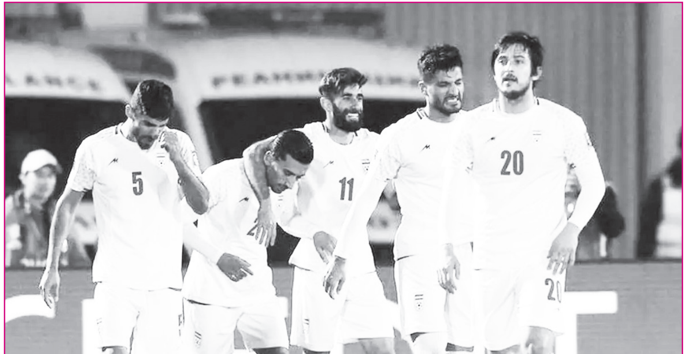
طرح نو؛ گروه ورزش

به نظر می‌رسد به‌زودی خبر رویارویی تیم ملی با صربستان و تونس در فینال ماه مارچ از سوی فدراسیون اعلام خواهد شد.