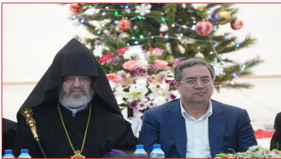
استاندار آذربایجان غربی با تأکید بر مبانی مشترک خداوند متعال، نخستین و مهم‌ترین وجه اشتراک پیروان ادیان الهی، گفت: ایمان به حضور و نظارت همیشگی

طرح نو؛ گروه خبر استاندار آذربایجان غربی گفت: این استان به ظرفیتی رسیده که می‌تواند وحدت و همدلی را به دنیا نشان دهد و یقین داریم هرچه همت و همراهی بیشتر باشد، توفیق و برکت الهی نیز افزون‌تر خواهد شد.