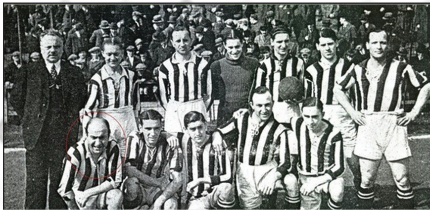
حسین صدقیانی اولین لژیونر فوتبال ایران در تیم شارلوا بلژیک سال ۱۳۱۰ شمسی نشسته نفر اول از سمت چپ

یکی از تاریخ سازترین مردان ورزش ایران بدون تردید مرحوم حسین صدقیانی است. مردی که او را پدر فوتبال در ایران می دانند. او سال ۱۲۸۱ در سلماس متولد شد. پدرش حاج رسول و مادرش عصمت از بزرگان شهر تبریز بودند