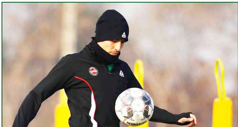
طرح نو؛ گروه ورزش

شاید مصدومیت ایگور پوستونسکی بیش از همه به نفع هافبک ازبکستانی تراکتور تمام شود. ایگور پوستونسکی هافبک مورد علاقه دراگان اسکوچیچ در بازی برابر ملوان با مصدومیت از ناحیه رباط صلیبی روبه‌رو شده تا حداقل تا پایان فصل در دسترس تیمش نباشد.