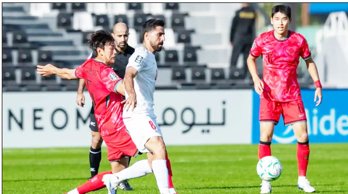
طرح نو؛ گروه ورزش

تیم امید ایران برای اولین بار برابر امیدهای کره‌جنوبی شکست نخورد و با کلین‌شیت زمین را ترک کرد.