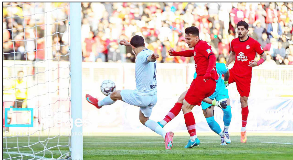
طرح نو؛ گروه ورزش

تراکتور در نیم فصل نخست لیگ برتر، از نظر آماری، تیم برتر در خلق موقعیت بود، اما تبدیل شدن فرصت‌ها به گل و تعداد تساوی‌ها، این تیم را از قرار گرفتن در صدر جدول بازداشت.