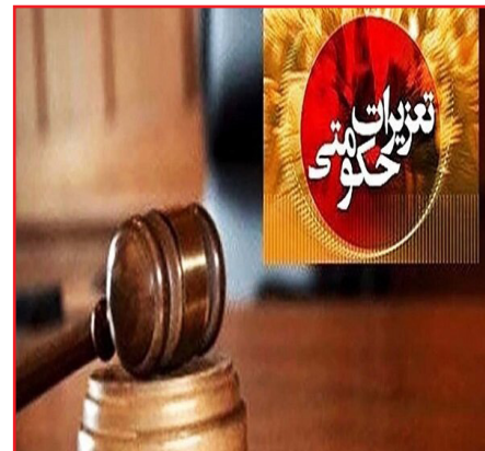
مربوط به بخش قاچاق کالا و ارز و هزار و ۳۹۹ فقره پرونده

وی اضافه کرد: در این راستا از تعداد ۱۶ هزار و ۴۰۸ واحد بازرسی و در فرایند این بازرسیها به ۶ هزار و ۶۳۶ واحد صنفی پرونده تخلفاتی تشکیل و متخلفان در شعب تعزیرات حکومتی استان به پرداخت ۳۷۵ میلیارد و ۵۲۴ میلیون ریال جزای نقدی محکوم شدند. وی ضمن اعلام آمادگی تعزیرات حکومتی استان جهت دریافت و رسیدگی فوری به شکایات و گزارشات مردمی از شهروندان درخواست کرد در صورت مشاهده هرگونه تخلف اقتصادی و صنفی، قاچاق کالا و ارز و بهداشت و دارو و درمان موضوع را از طریق سامانه اینترنتی www.irtaziratr5.ir یا با شماره تلفن ۱۳۵ به تعزیرات حکومتی استان و با شماره تلفن ۱۲۴ به اداره کل صنعت، معدن و تجارت استان گزارش کنند.