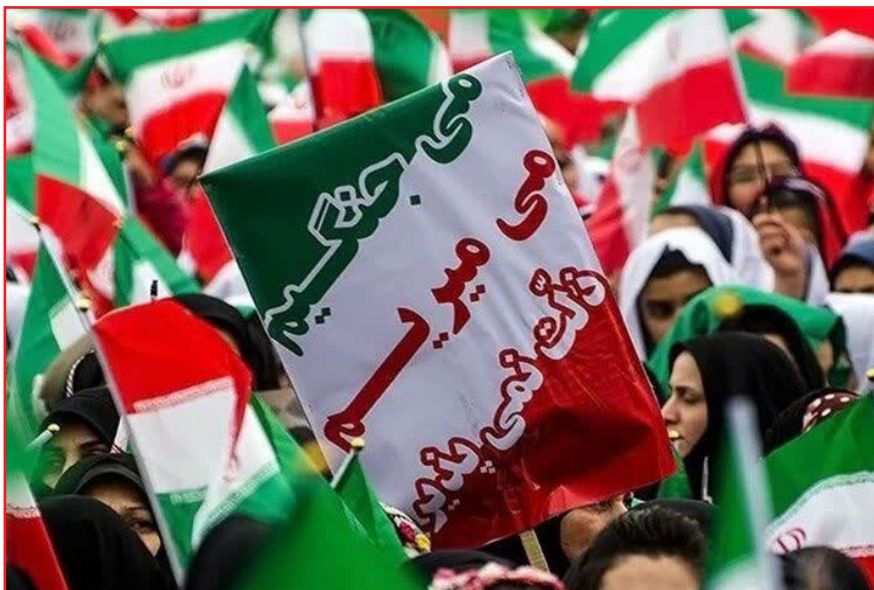
بوده است، حرکتی که محور آن خدا و به سمت حق و مبارزه با باطل بنا شده است.

مبارزه ای که از آغاز خلقت با باطل بوده و اگر وحدت مردم و انسجام آن‌ها نباشد نمی تواند پیروز میدان باشد.