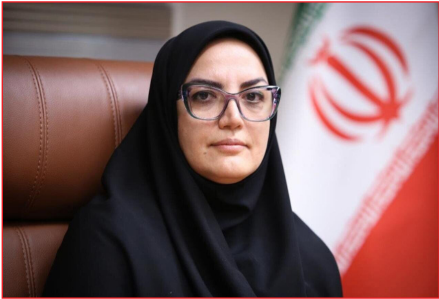
زیرساخت‌های خود را از دست داد.

نظربند همچنین با اشاره به وضعیت کتابخانه عمومی مصلی آیت‌الله اعرافی شهرستان میبد در استان یزد، بیان کرد: این مرکز فرهنگی با بیش از ۷ هزار جلد کتاب و ۵۰۰ عضو فعال در جریان نآرامی‌ها دچار حریق شد. عمده کتاب‌های آسیب‌دیده شامل منابع آموزشی و کمک‌آموزشی بودند که برای استفاده دانش‌آموزان و آینده‌سازان ایران گردآوری شده بودند. سوختن این منابع در میبد که با همت خیران فرهنگ‌دوست آماده شده بود، ضربه‌ای جبران‌ناپذیر به قشر دانش‌آموز منطقه است که در آستانه امتحانات و نیاز مبرم به منابع درسی، دسترسی برابر به امکانات آموزشی را با مشکل مواجه کرده است.