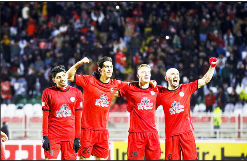
این سه تورنمنت را در سر می‌پوراند، تقویت قوای دفاعی و هجومی‌اش، نه یک انتخاب، که یک الزامی انکارناپذیر است.

این وضعیت در شرایطی رخ می‌دهد که اسکوچیچ، پیش‌تر با تاکید بر ضرورت عمق بخشیدن به ترکیب تیم برای مدیریت فشار بازی‌ها، خواهان جذب بازیکنان جدید شده بود. خواسته این سرمربی کارکنش، با توجه به حضور همزمان تراکتور در سه جبهه رقابتی (لیگ برتر، جام حذفی و لیگ نخبگان آسیا)، منطقی و حساب‌شده به نظر می‌رسید. در قواموس فوتبال، تیمی در قواره تراکتور که سودای موفقیت حداکثری در