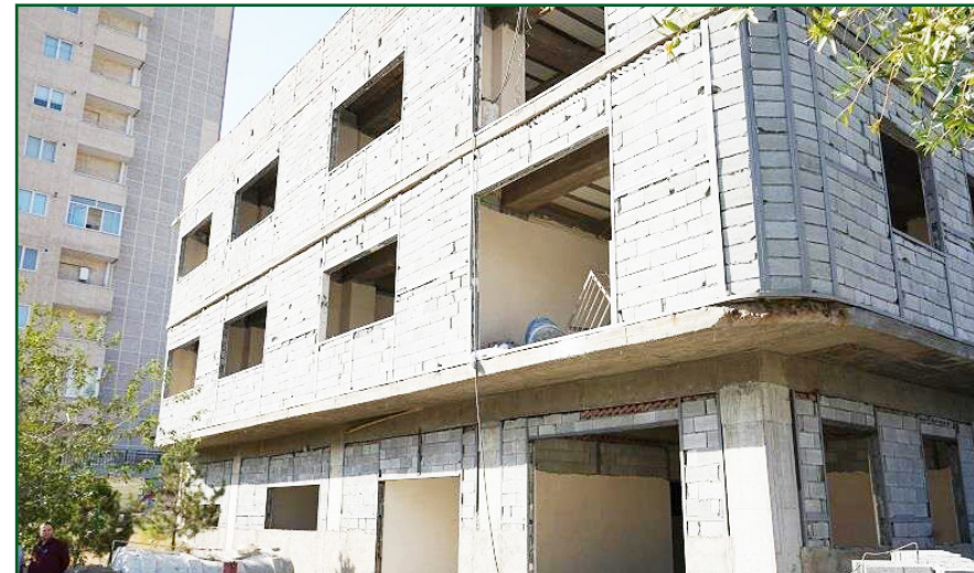
طرح نو؛ گروه شهری

شهردار منطقه ۲ از احداث دو فرهنگسرای فراموز و شمس آباد توسط این منطقه خبر داد.