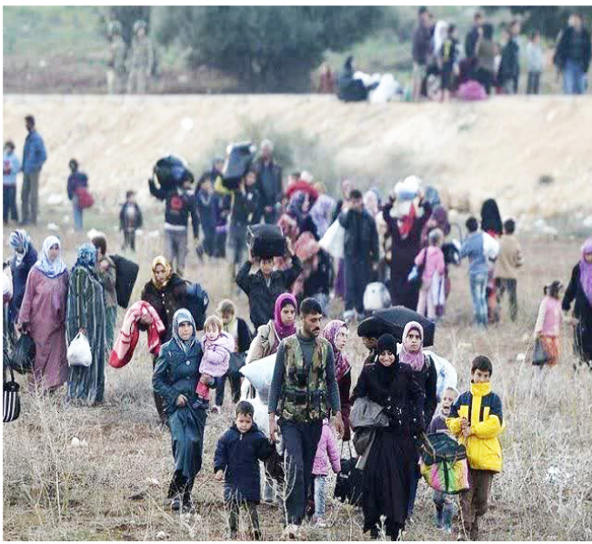
طرح نو؛ سردبیر

در دو دهه اخیر، خاورمیانه و شمال آفریقا شاهد یکی از پیچیده‌ترین فصل‌های تاریخ معاصر خود بوده‌اند؛ فصل ویرانی ملت‌ها زیر نام آزادی، دموکراسی و حقوق بشر. در میان این کشورها، دو نام سوریه و لیبی بیش از همه در خاطر جهانیان باقی مانده است. دو سرزمین برخوردار از منابع غنی، سطح رفاه نسبی، نظام‌های سیاسی مقتدر و موقعیت ژئوپلیتیکی بی‌بدیل، که در کمتر از چند سال با دخالت مستقیم و غیرمستقیم قدرت‌های غربی، از ثبات به آشوب، از رونق به فقر، و از هویت ملی به تفرق قومی و مذهبی کشیده شدند. امروز، مردم همین کشورها که روزی فریب شعارهای آزادی را خوردند، در ویرانه‌های جنگی به دنبال همان روزهای به ظاهر استبدادی اما امن، منسجم و باثبات گذشته‌اند.