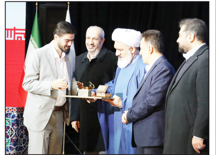
طرح نو: گروه شهری

۲۳ نفر از چهره های ماندگار و زنده نامان تبریز طی مراسمی ویژه مورد تقدیر قرار گرفتند.