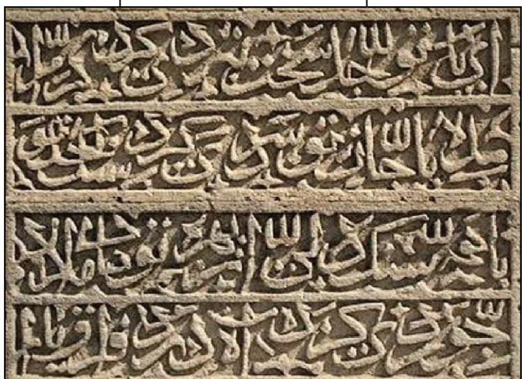
سنگ مزاری منقش به شعر فارسی در آرامستان بی‌بی رحیمه؛ روستای نارداران در جمهوری آذربایجان

جمهوری آذربایجان، بزرگ‌ترین کشور در قفقاز جنوبی و در کنار دریای کاسپین واقع است. بر اساس آخرین اطلاعات، جمعیت این کشور حدوداً ۱۰ میلیون نفر برآورد می‌شود. این سرزمین که تا حدود دو بیست سال پیش جزوی از خاک ایران بود، در جنگ‌های ایران و روسیه و طی قراردادهای گلستان و ترکمنچای به روسیه ملحق، و بعد از فروپاشی شوروی، به کشوری مستقل و کوچک تبدیل شد